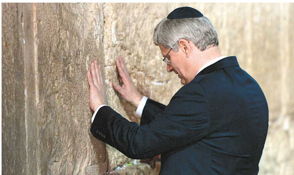
Le premier ministre Stephen Harper se recueillant au mur des Lamentations, à Jérusalem mardi.