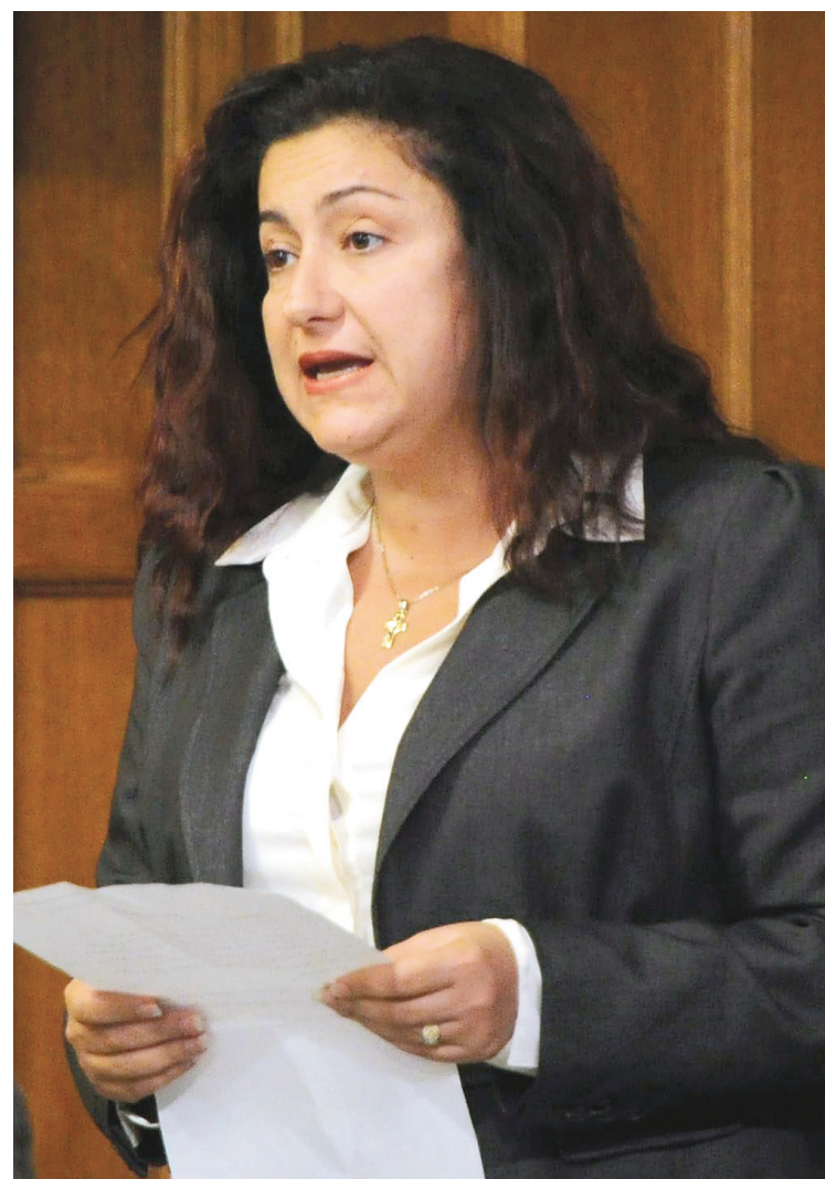
Maria Mourani a été expulsée du caucus bloquiste en septembre.