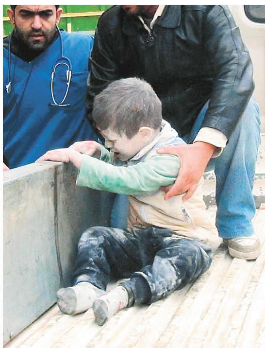
Un enfant reçoit de l'aide après avoir été blessé au cours d'une frappe aérienne effectuée mardi près d'une école à Alep, dans le nord-ouest de la Syrie.

Le conflit en Syrie a forcé deux millions de personnes à trouver refuge à l'étranger, mais également plus de trois millions d'autres à se dé-