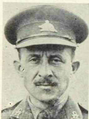
Major Général Thomas-Louis Tremblay, C.M.G., D.S.O., A.D.C.

1946 est le 32ième anniversaire de la formation du 22ième Régiment (Canadiens-Français), et le 30e anniversaire de sa première grande victoire . . . . COURCELETTE.