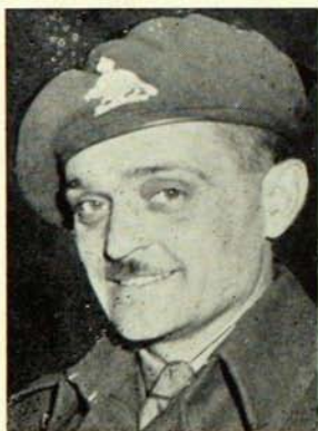
Lieutenant-Colonel Paul Triquet, V.C.

En lettres de feu, trois des pages les plus glorieuses de l'histoire du 22 e portent pour titres: Keable-Vitasse-Neuville 1918, Brillant-Méricourt 1918 et Triquet-Casa-Bérardi 1943.