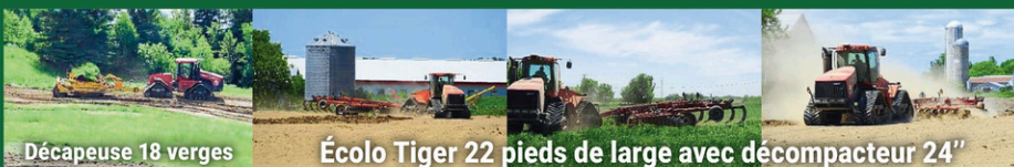
Décapeuse 18 verges

On ne peut pas vous décrocher la lune... MAIS ON PEUT DÉPLACER DES MONTAGNES!