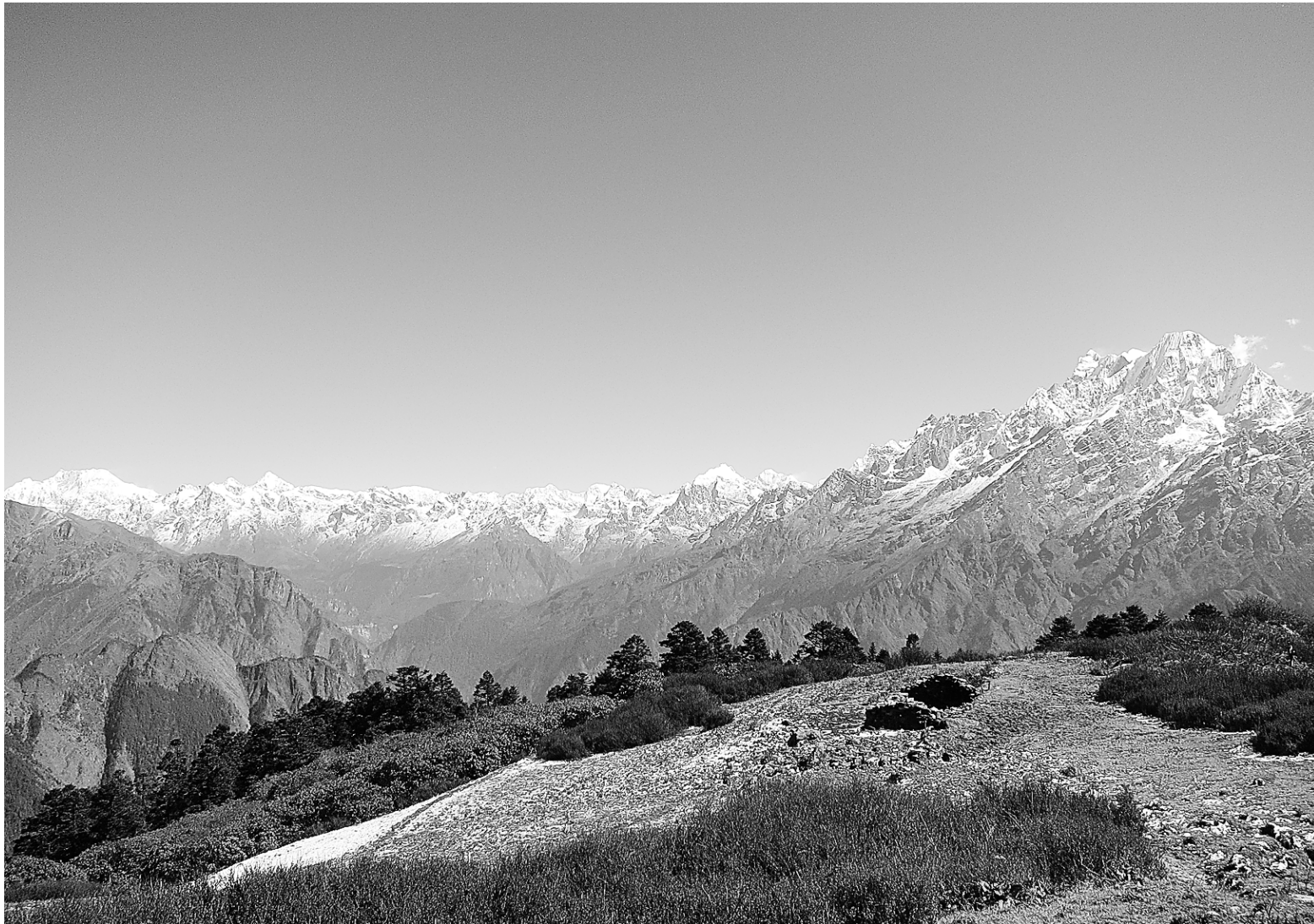
Les pics enneigés du Tibet originel des Tamangs

origines du Tibet voisin, dont ils suivent les traditions culturelles et religieuses. Pas une maison sans son petit temple familial agrémenté d'une photo du dalaï-lama. Leur langue tibéto-birmane, par contre, est unique.