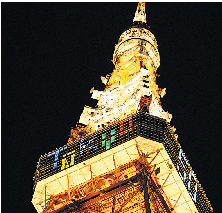
La tour de Tokyo, peinte en orange et blanc, inspirée du modèle de la tour Eiffel.

La tour de Tokyo, construite en 1958 et peinte en rouge et blanc, est l'une des rares copies à dépasser en taille l'original (333 mètres, temporairement réduits à 312 mètres en 2011 quand l'antenne qui la surplombe, tordue par un violent séisme, avait dû être retirée pour être réparée). Cette tour de télévision reste un monument emblématique de la capitale japonaise, même si elle a été supplantée en 2012 par la Tokyo Sky Tree, près de deux fois plus haute.