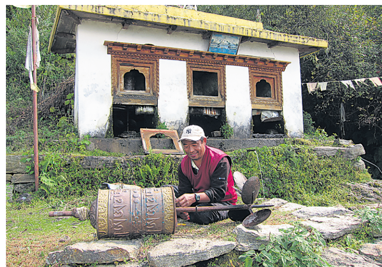
Un réparateur de moulins à prières.