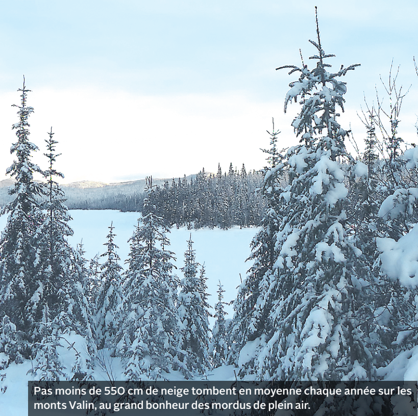
Pas moins de 550 cm de neige tombent en moyenne chaque année sur les monts Valin, au grand bonheur des mordus de plein air.

dénivelé prononcé, mais il donne en récompense quelques superbes perspectives sur les montagnes environnantes et les installations du Valinouët. Départ de la route en bas du bassin de décantation du village.