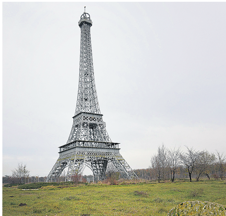
Une copie de 54 mètres de la tour Eiffel en banlieue de Bucarest.