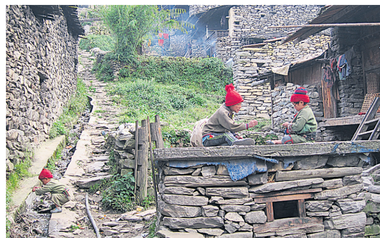
Gatlang compte une centaine de maisons identiques, murs en pierres nues, toit de planches et façade en bois sculpté, typiques de l'architecture tamang.