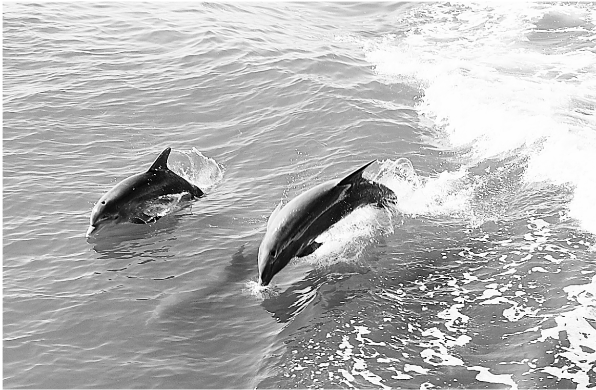
Le long de la route vers Cabbage Key, les dauphins ne se font pas prier pour se donner en spectacle.