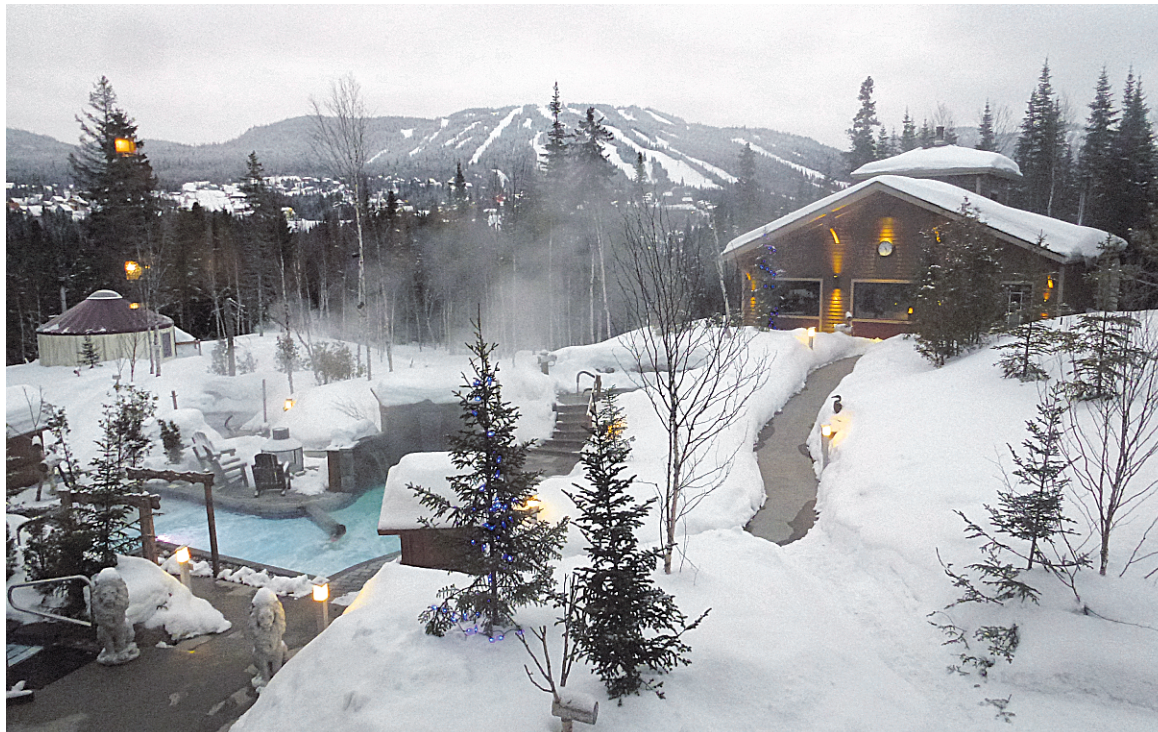
Pour la détente après les sports d'hiver, le SPA nordique L'Éternel se révèle un choix heureux.