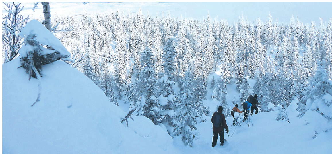
Le parc national des Monts-Valin compte 65 km de sentiers de ski et 71 km consacrés à la raquette.

Les monts Valin, c'est cet imposant rocher blanc qui occupe l'horizon au large de Chicoutimi au sortir de la réserve faunique des Laurentides. Quelques chiffres, puisqu'il en faut pour comprendre les proportions de cet environnement. Tout le massif, qui fait partie de la chaîne des Laurentides, couvre une superficie de 6900 km 2 et près d'une vingtaine de sommets y frisent 1000 mètres d'altitude. Le parc national des monts Valin n'occupe que 154 km 2 de cet espace sur un versant. La station de ski alpin Le Valinouët et les 500 chalets cossus de son village alpin se trouvent sur l'autre versant. Tout le reste de