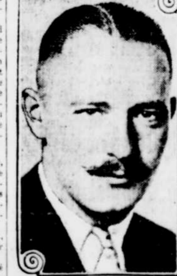
NORMAN KERRY "THE ACQUITAL"