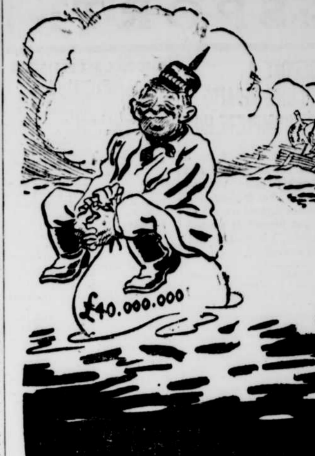
De "Liverpool Daily Courier"

Se servir des Petites Annonces c'est trouver ce que l'on cherche