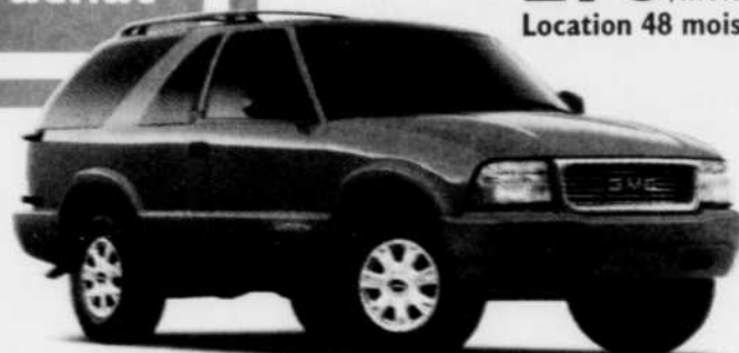
Jimmy SLS 2 portes 4x4

La robustesse d'un GMC à prix confortable