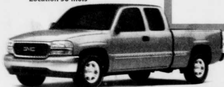
Sierra SL à cabine allongée

Combinaison de puissance (moteur Vortec V8) et de confort (climatiseur)