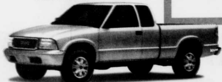
Sonoma SLS à cabine allongée 4x4

Capacité maximale de chargement en version compacte