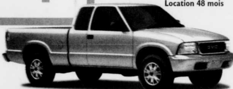
Sonoma SLS à cabine allongée 4x2

La force d'un pick-up. L'âme d'une voiture de sport.