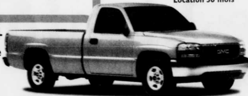
Sierra SL à cabine régulière

Combinaison parfaite de puissance, de durabilité et de maniabilité