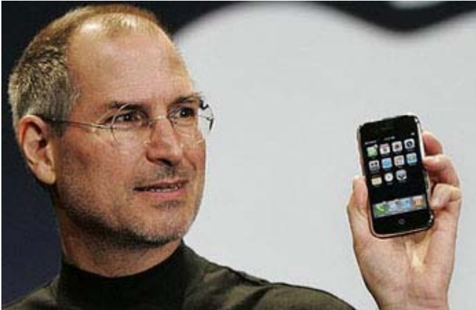
Steve Jobs et son iPhone

Le grand talent de Steve Jobs (52 ans) est de savoir susciter de la convoitise envers ses ordinateurs et ses gadgets. Ce genre de talent est peu commun et il permet d'influencer les habitudes de vie d'une société. Dans ce cas-ci, c'est le monde entier qui est aux aguets du nouveau iPhone . Cette invention est un véritable succès sur le plan du marketing et ceux qui ont goûté au fameux produit n'ont que des louanges à son égard. Deux problèmes: le manque d'appareils disponible et l'absence d'un réseau d'accès universel. Mais c'est justement cette pénurie qui crée la convoitise. Le spécialiste en technologie du Wall Street Journal et organisateur de "D: All Things digital", Walt Mossberg a analysé le iPhone. (Voir site Internet) www.LeStudio1.com/iPhone