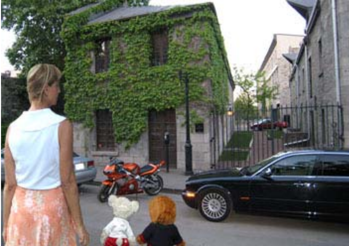
Mademoiselle X et les deux mascottes, Miss Gym et son frère Monsieur X devant un restaurant célèbre du Vieux-Montréal.

«Les femmes sont comme un sachet de thé: on s'aperçoit de leur résistance quand on les plonge dans l'eau bouillante." -Eleanor Roosevelt