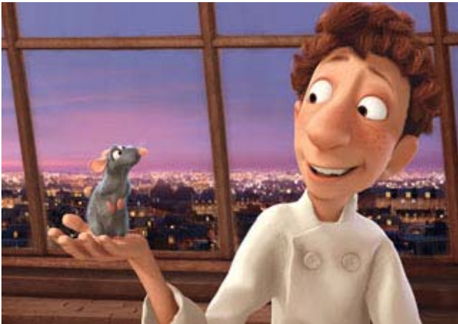
Le rat Rémy et le chef Linguini