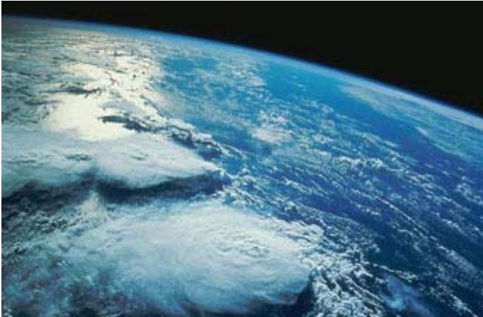
Photo par satellite de la Terre

La date du 07-07-07 sera soulignée de façon unique alors que plus de 150 artistes-musiciens animeront une série de concerts simultanés présentés dans 8 grandes villes du monde dont Montréal, New-York et Londres (le Brésil a annulé). L'événement planétaire a pour objectif de sensibiliser la population au réchauffement climatique. Les concerts seront diffusés sur Internet, sur le réseau télé NBC et les radios satellites. En tout, on compte plus de 7000 autres événements spéciaux qui sont aussi organisés pour cette journée du 7 juillet dans plus de 129 pays, en parallèle avec le concert. À Montréal, le concert se tiendra dans le Vieux-Port.