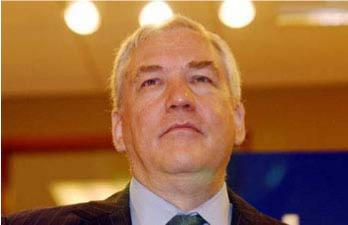
Conrad Black

Le destin de Conrad Black (63 ans) est pour le moins imprévisible.