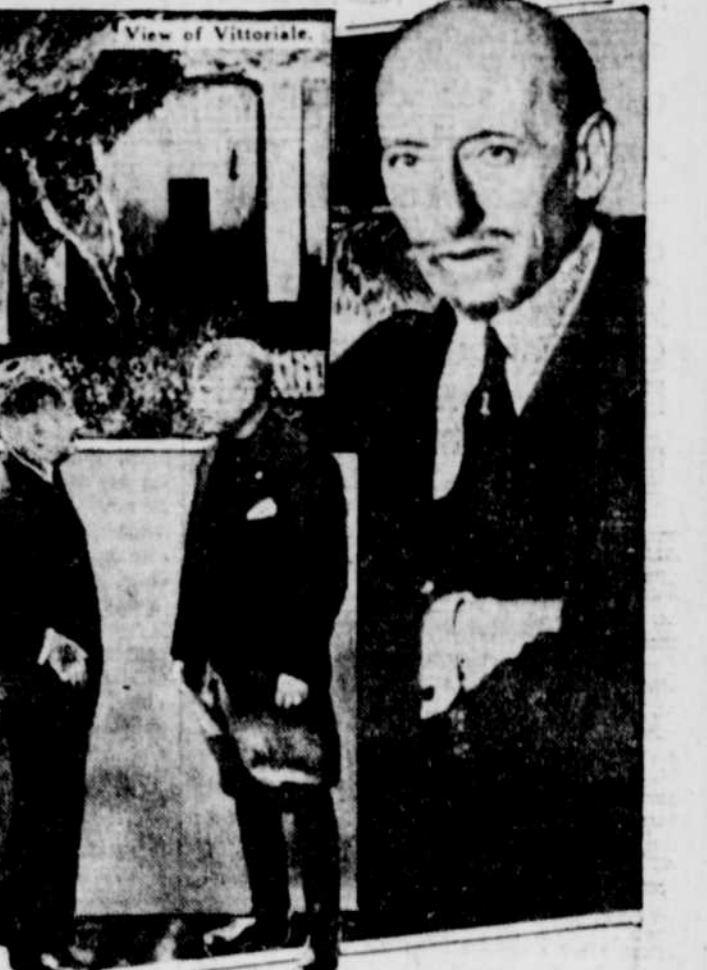
The poet and Mussolini. Gabriele D'Annunzio