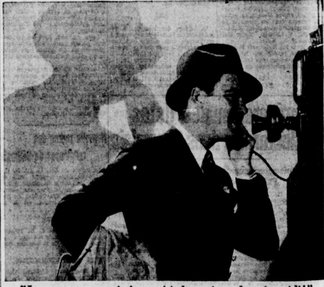
"Je regrette — mais je serai à la maison demain midi!"