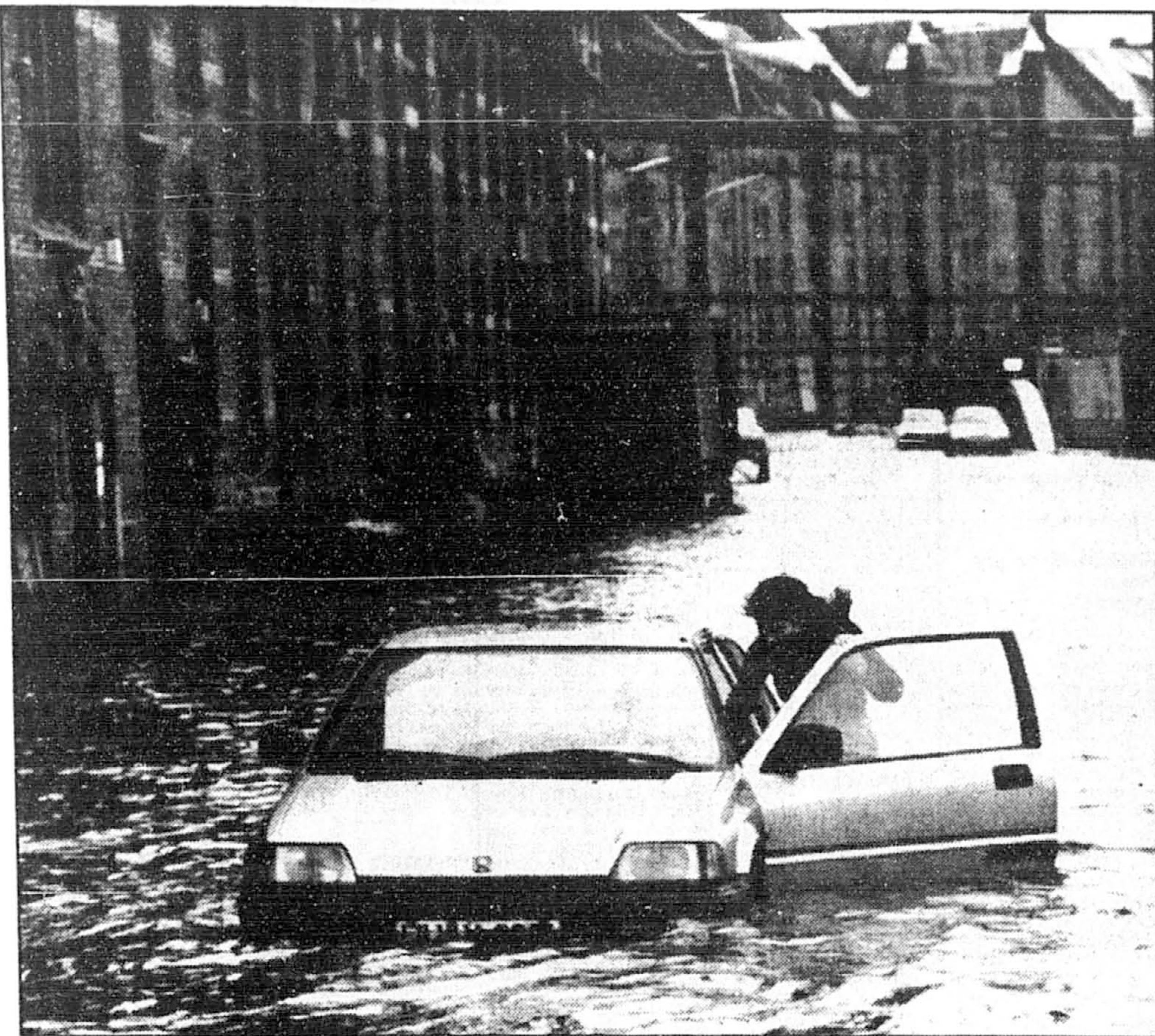
Une femme s'efforce de sortir sa voiture à moitié submergée dans le quartier voisin du port allemand de Hambourg. C'est une tempête de neige qui a provoqué le débordement de l'Elbe et l'inondation.