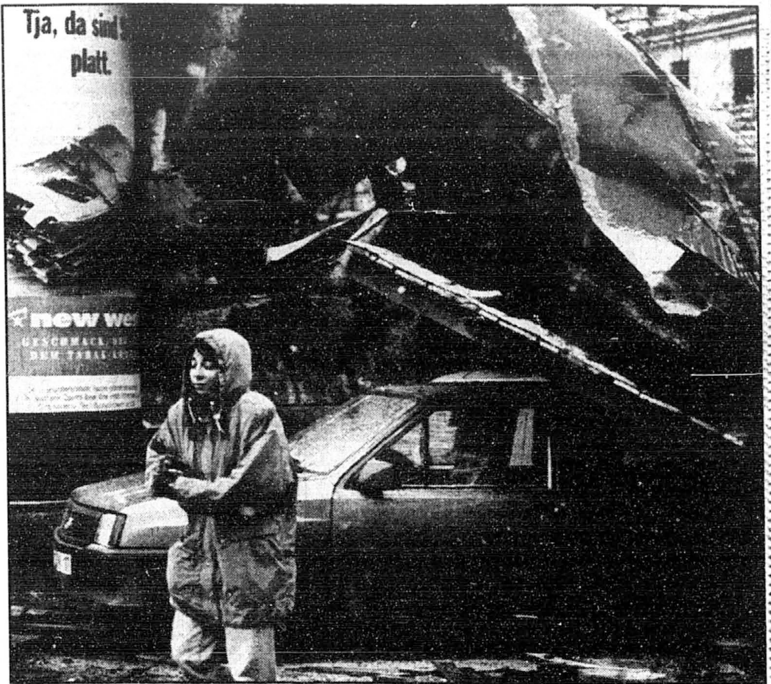
Une femme passe près d'une voiture endommagée par un toit de maison qui s'est effondré à Munich. Des vents d'une extrême violence ont causé des dégâts hier dans de nombreuses régions d'Allemagne et fait cinq morts.

La plupart des gens croient qu'il n'y a qu'une seule façon d'aider le monde en développement.