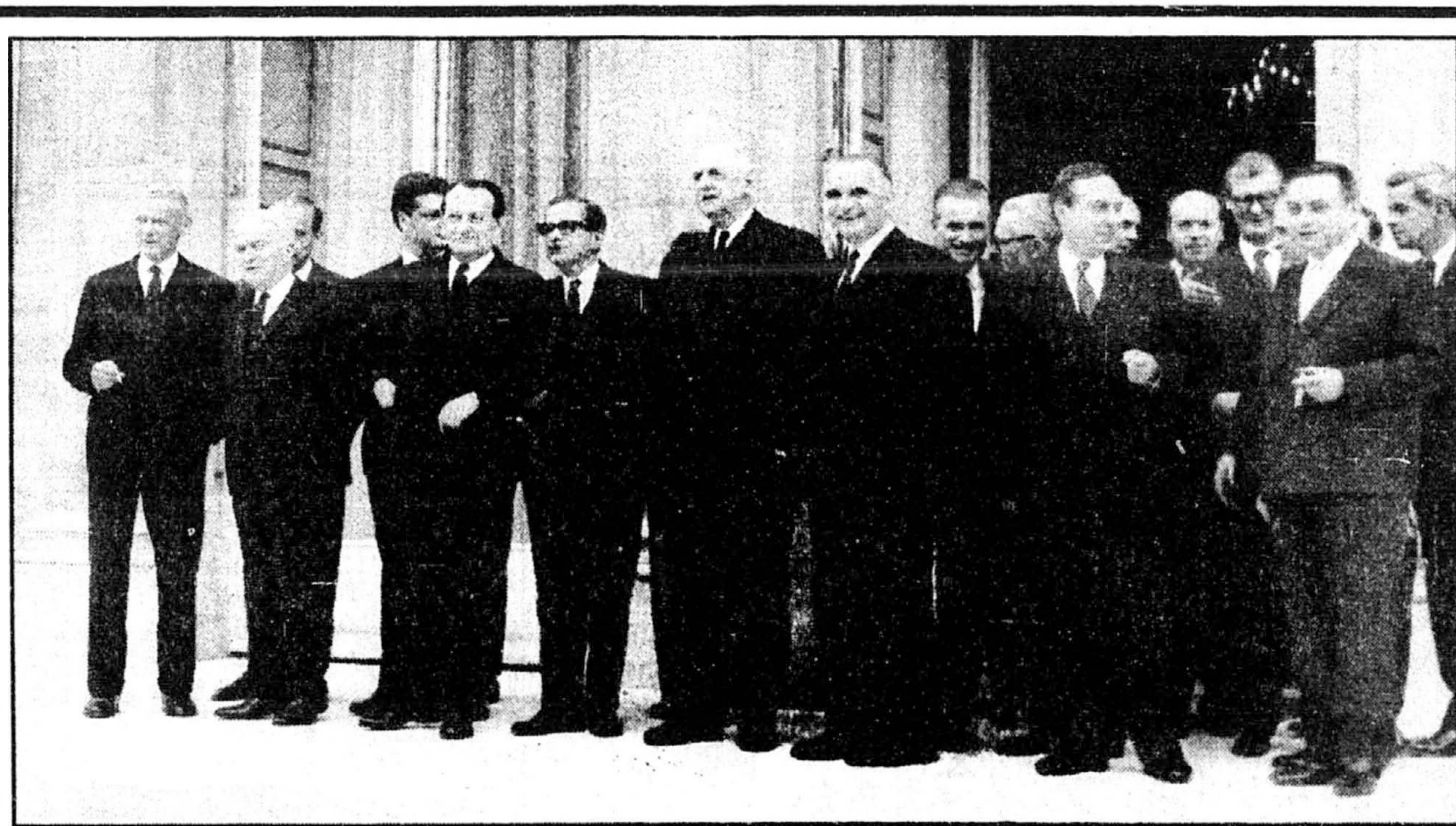
L'accueil que Paris réservera au premier ministre Daniel Johnson, la semaine prochaine, sera sans doute beaucoup plus discret que celui accordé à son père Daniel, en mai 1967, quelques semaines seulement avant la venue du général de Gaulle au Québec. Cette photo d'époque nous montre feu Daniel Johnson, sur le parvis de l'Élysée, en compagnie, de gauche à droite, de MM. Couve de Murville, Louis Joxe, André Malraux, le général de Gaulle, Georges Pompidou, Michel Debré et Jacques Chaban-Delmas. Derrière, plusieurs des conseillers qui accompagnaient M. Johnson.

Son ministère s'affaire à planifier les coupes de budget, incluant les fermetures de bases.