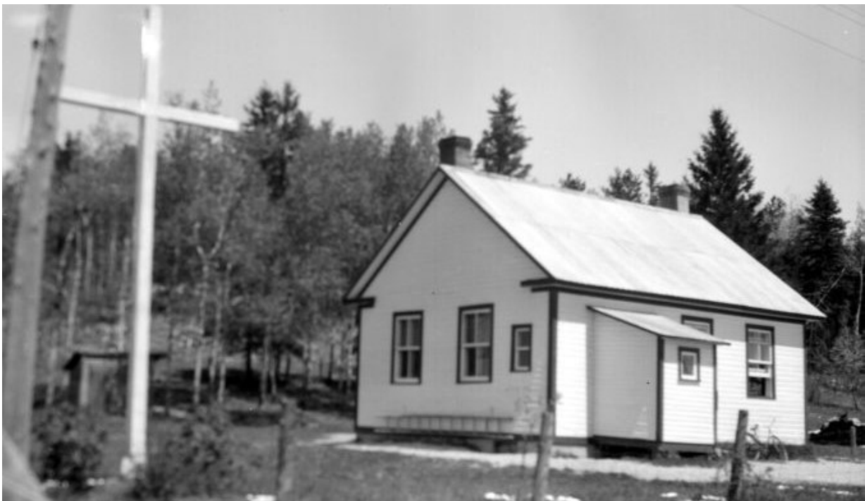
École de rang à Ville-Marie en 1946 (Abitibi-Témiscamingue)

Nous devions habiter l'école elle et moi. Mon père viendrait nous voir les fins de semaine et nous nous retrouverions aux vacances d'été. À l'âge de quatre ans et demi, je ne pouvais pas être scolarisée. J'ai passé cette année-là à jouer sans bruit dans la salle de classe durant le temps que ma mère enseignait aux élèves. À la fin de l'année, elle découvrit que je savais lire à force d'écouter ce qu'elle disait aux autres. L'année suivante, j'eus droit à mon pupitre et à mon livre de lecture. Durant les neuf années qui suivirent, je connus cinq écoles différentes.