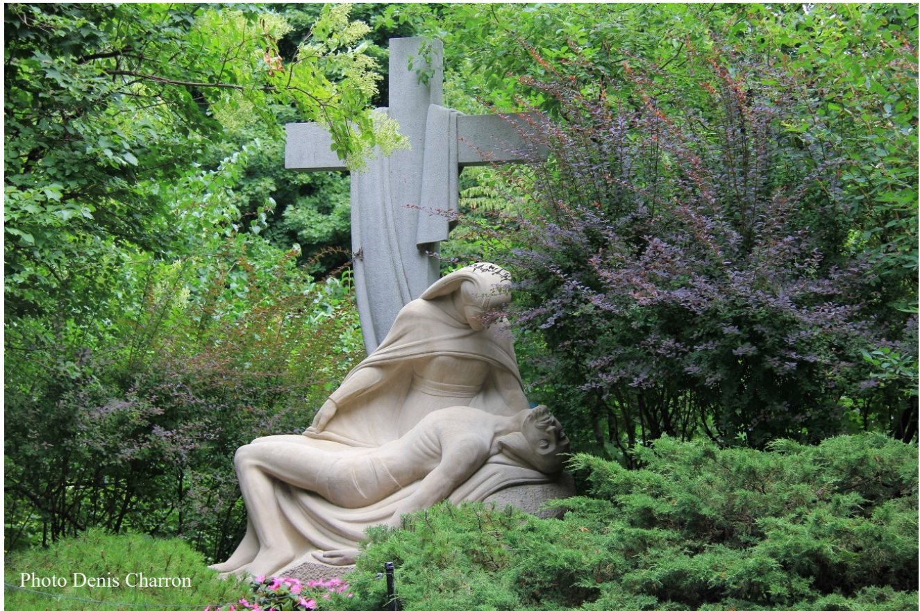
Chemin de croix de l'Oratoire Saint-Joseph, Montréal