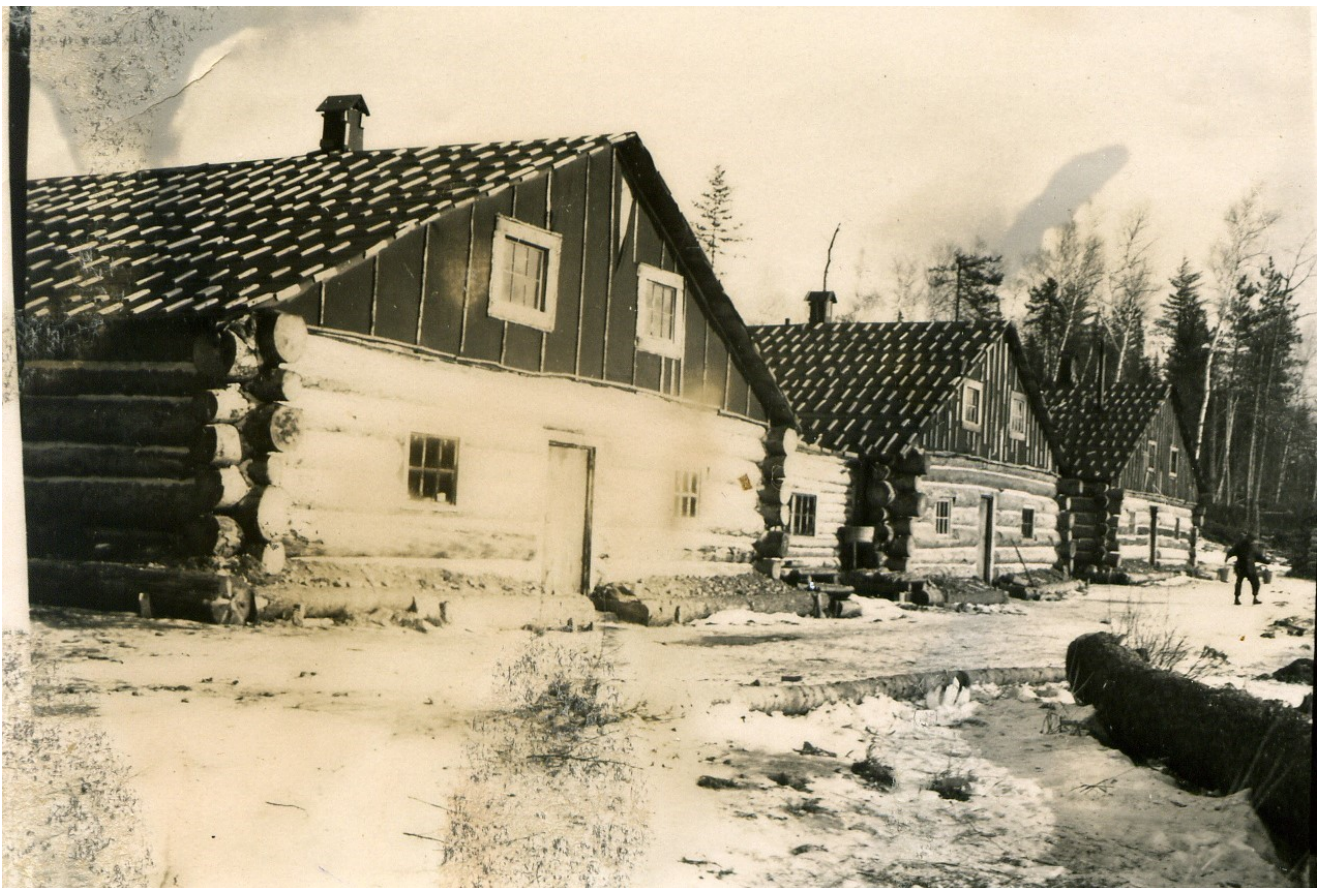
Camp de bucherons dans les années 1930

(D'abord publié dans le Trait d'union Volume 13 - N° 2 février 2006)