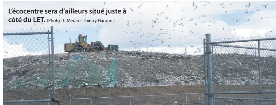
L'écocentre sera d'ailleurs situé juste à côté du LET.

L'écocentre sera d'ailleurs situé juste à côté du