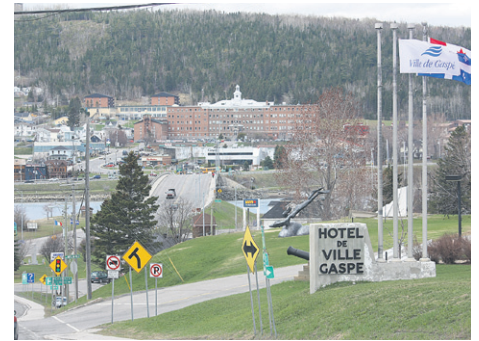
Selon le conseil municipal de Gaspé, les finances Ville se portent bien malgré un budget d'opération restreint.

Il a également rappelé que cette situation était due pour une large part, aux diminutions des paiements gouvernementaux (transferts de TVQ, en-lieux de taxes sur les édifices) et à l'augmentation des responsabilités confiées aux municipalités. La seule avenue possible pour poursuivre la gestion de la ville sans trop affecter son budget était donc d'augmenter le compte de taxe des citoyens (4,9%).