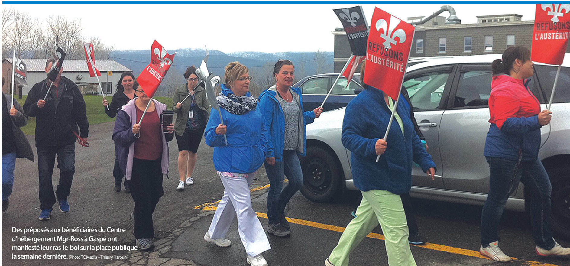
Des préposés aux bénéficiaires du Centre d'hébergement Mgr-Ross à Gaspé ont manifesté leur ras-le-bol sur la place publique la semaine dernière.