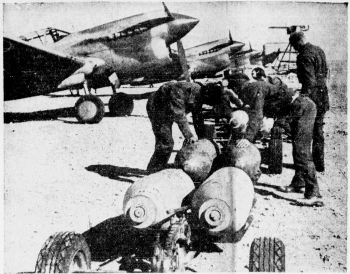
On voit ici, le chargement des bombes destinées au corps africain de Rommel actuellement en fuite. Le chargement des bombardiers s'opère d'un aérodrome de la Tripolitaine. Les gros bombardiers ont été le principal atout des Alliés depuis que la présente attaque fut déclenchée à El Alamein.