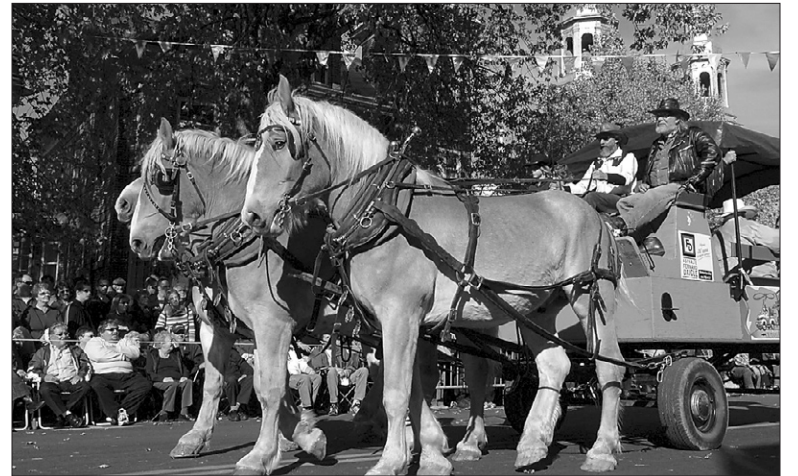
Le traditionnel défilé ne manque jamais d'attirer les foules.