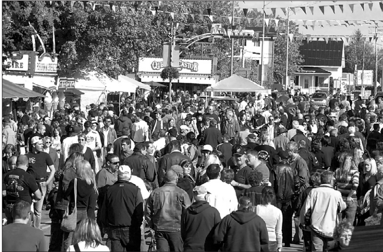
La foule est toujours très nombreuse lors des activités du Festival de la galette de sarrasin de Louiseville.