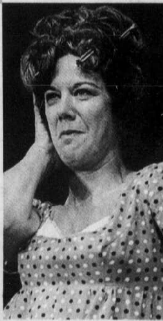
ARCHIVES LE DEVOIR

Victoire, disons-nous? Pourquoi pas. D'autant plus que les dramaturges québécois semblent avoir pris le contrôle des salles montréalaises. Mais cela, à ce qu'il paraît, ne suffit pas: une dramaturgie ne peut pas survivre quand un texte n'est joué localement qu'une vingtaine