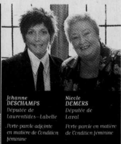
Johanne DESCHAMPS Députée de Laurentides—Labelle