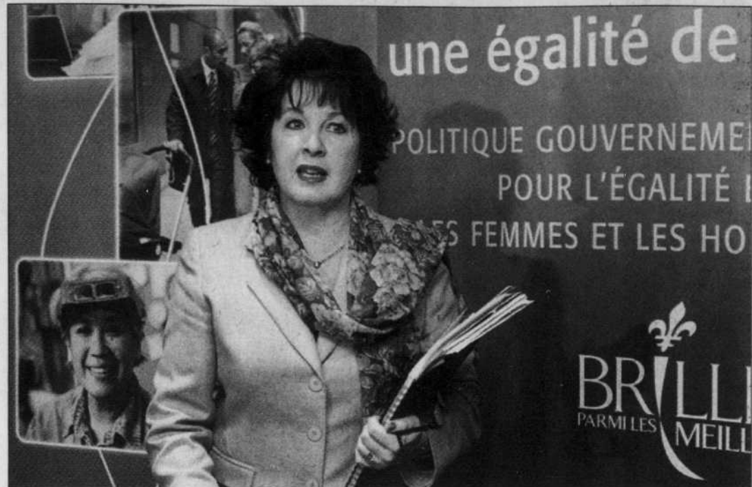
La ministre de la Famille, des Aînés et de la Condition féminine, Carole Thérberge

Cette ancienne secrétaire d'État à la condition féminine aurait souhaité que l'analyse différenciée selon les sexes (ADS) soit étendue à l'ensemble des ministères et des politiques. Le plan d'action triennal prévoit l'application de l'ADS à une quinzaine de projets, de programmes ou de mesures. La poli-