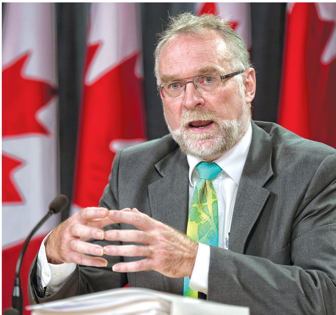
ADRIAN WYLD LA PRESSE CANADIENNE

Espérons maintenant que la même bonne volonté prévaut dans le dossier des compressions budgétaires et qu'on nous épargnera une bataille juridique avec le DPB. Après tout, ce dernier veut seulement savoir si les ministères sont capables de générer les économies promises et, par conséquent, de respecter le cadre budgétaire — à court et à long terme — du ministre Flaherty.