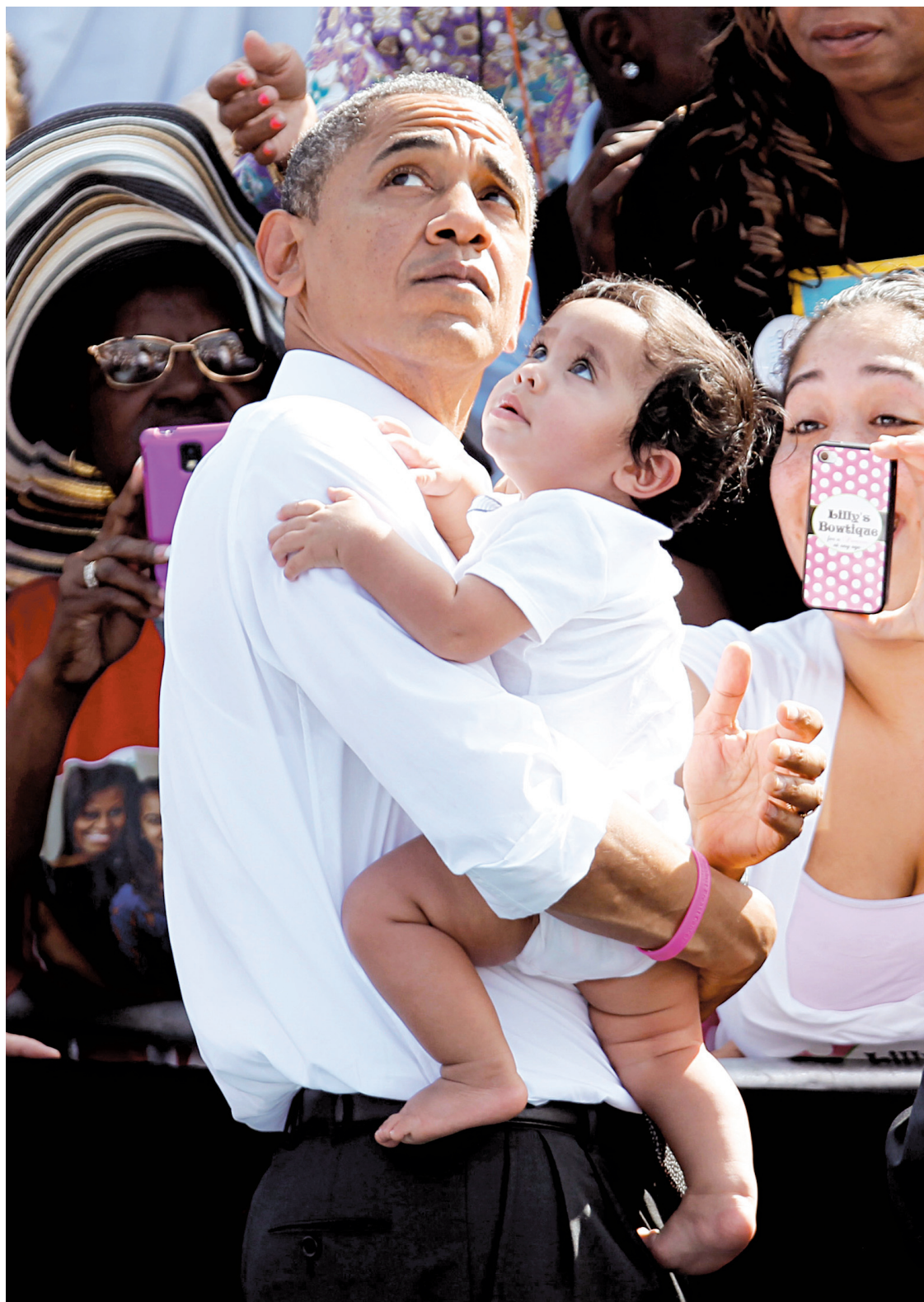
Le président américain, Barack Obama, tenant un enfant dans ses bras lors d'une visite à Delray Beach, en Floride, mardi, au lendemain du dernier face-à-face avec le républicain Mitt Romney.