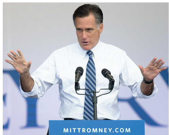
Le candidat républicain Mitt Romney a fait campagne à Las Vegas mardi.

L'Amérique d'Obama ira-t-elle aux urnes? C'est ce qui peut encore empêcher la réélection d'Obama. Tous les sondages montrent un écart considérable entre le corps électoral en général, qui donne quatre ou cinq points d'avance à Obama, et les « votants probables », parmi les-