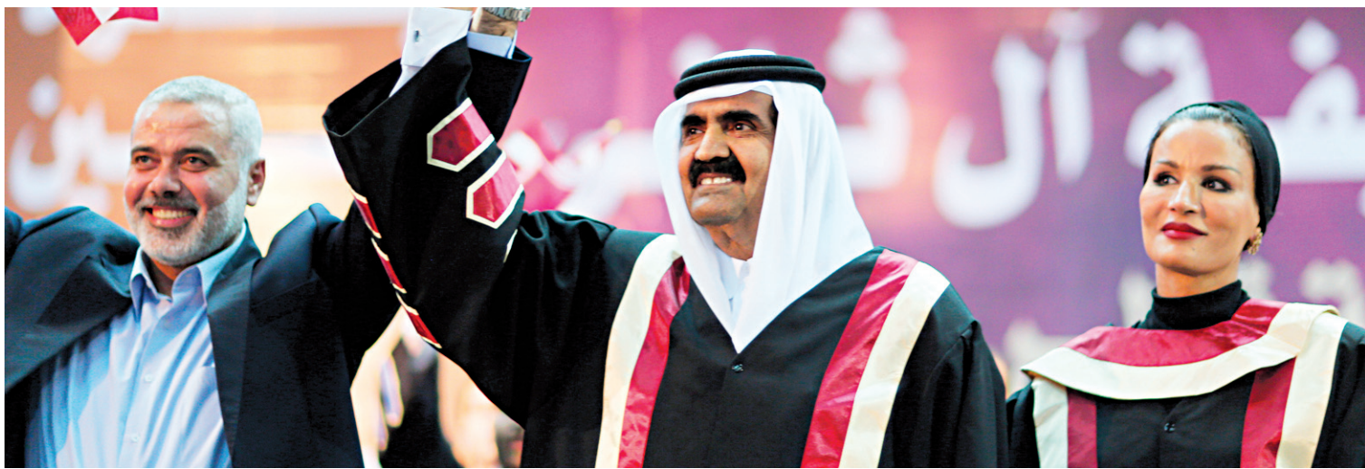
L'émir du Qatar, cheikh Hamad ben Khalifa al-Thani (au centre), mardi avec son épouse et Ismail Haniyeh, du Hamas.