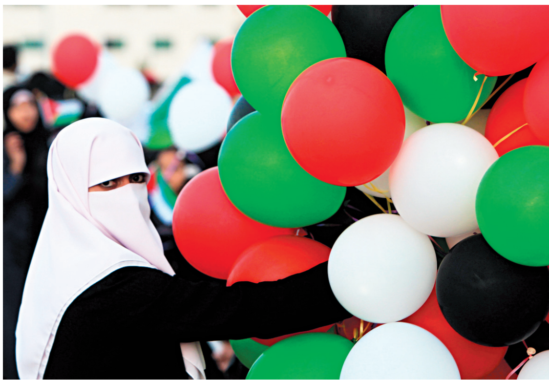
L'émir du Qatar a été accueilli avec joie à Gaza.

«Il est temps de tourner la page de la division palestinienne d'ouvrir le chapitre de la réconciliation et du consensus, sur la base de ce qui a été discuté à Doha et au Caire grâce aux efforts sincères du président palestinien, Mahmoud Abbas et du chef du bureau politique du Hamas, Khaled Mechaal», a-t-il dit en référence au laborieux processus de réconciliation nationale.