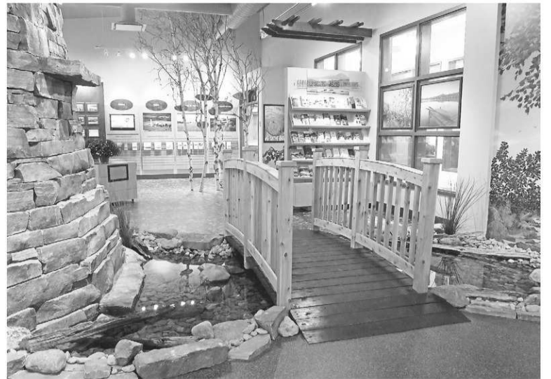
Un aperçu de l'aménagement du nouveau Bureau d'information touristique de Memphrémagog.

route 10 à Magog. Celui-ci, qui a ouvert ses portes en septembre 2012, est l'un des plus grands au Québec et il connaît déjà une hausse impressionnante de son achalandage comparativement