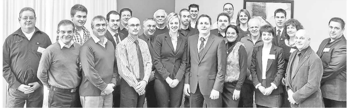
Un groupe d'entrepreneurs de Magog-Orford.

Un entrepreneur, c'est autant un travailleur autonome, un commerçant, un proprié-