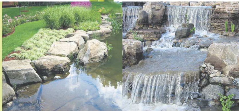
Photos de travaux réalisés par La sagesse de l'eau Inc.

Nous pouvons aussi réaliser les travaux pour vous.