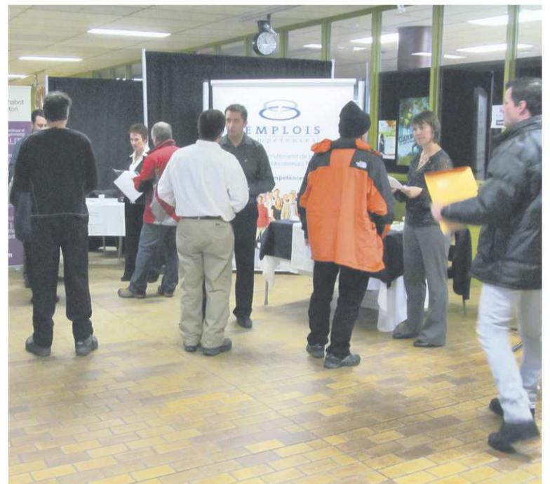
Différents kiosques ont su intéresser les chercheurs d'emploi présents lors de la dernière édition du Speed dating de l'emploi.

de l'emploi c'est encore mieux. Pour cause, la majorité des chercheurs d'emploi répondent à des offres que l'on retrouve dans les journaux ou sur Internet, et ne savent pas qu'en réalité elles ne représentent qu'environ 20 % des emplois disponibles. Le marché caché de l'emploi renferme l'autre portion, soit 80 %, des postes qui ne sont pas publiés. Alors, comment faire pour découvrir ces offres emplois qui ne sont pas mises à la disposi-