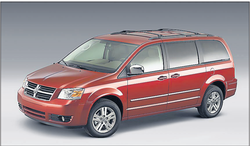
Le Grand Caravan 2008