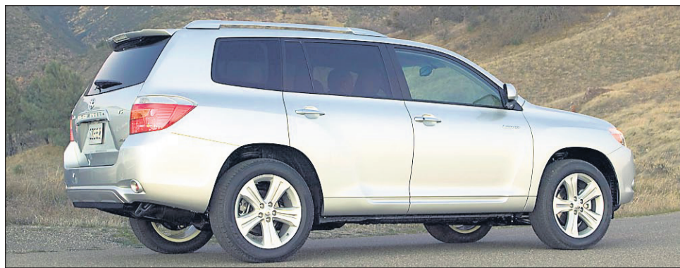
En général, le gris est la couleur préférée des acheteurs d'autos.

Parmi les autres additifs fort populaires dans cette catégorie figurent également les produits destinés à nettoyer le système d'injection. On sait qu'à la longue, les dépôts peuvent se former sur les injecteurs ou les soupapes, ce qui finit par affecter leur rendement (ralenti irrégulier, perte de puissance du moteur quand il est sollicité, augmentation de la consommation d'essence, etc.) Encore une fois, la même règle d'or prévaut : consultez un expert avant de faire quoi que ce soit parce que le problème peut être ailleurs (bougies en mauvais état, filtre à air sale, etc.)