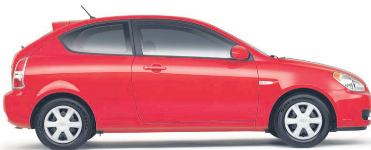
(MODÈLE ACCENT GS 3 PORTES MONTRÉ)