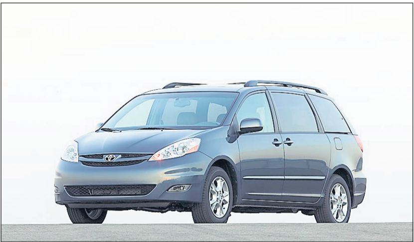
La Toyota Sienna XLE

À noter que ces deux nouvelles fourgonnettes sont le fruit d'une collaboration avec Volkswagen. Le constructeur allemand entend commercialiser sa propre version dans la prochaine année.