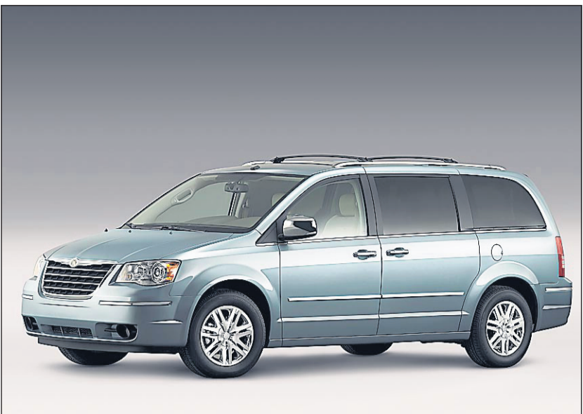
Le pionnier de la fourgonnette, Chrysler, se prépare à lancer sa sixième génération de ce type de véhicules, notamment le nouveau Town & Country.