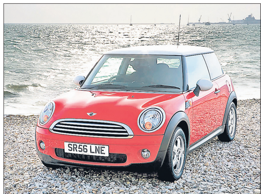
La Mini Cooper S

une Dodge, n'est-ce pas ? À la SX SRT-4 succède donc cette Caliber SRT-4 dévoilée cette semaine au salon de Chicago. Comme sa devancière, elle est animée d'un quatre-cylindres, mais qui délivre cette fois 300 chevaux aux roues avant... Est-ce bien raisonnable ? Toujours est-il que le châssis, lui, a fait l'objet de plusieurs transformations pour encaisser un tel surcroît de puissance. La géométrie des éléments suspenseurs a complètement été changée, la garde au sol abaissée, le rapport de démultiplication de la direction modifié et le système de freinage renforcé. Pour transmettre les 300 chevaux et les 260 livres-pied de couple au train avant, cette Caliber SRT-4 retient les services d'une boîte manuelle à six rapports, la seule disponible.