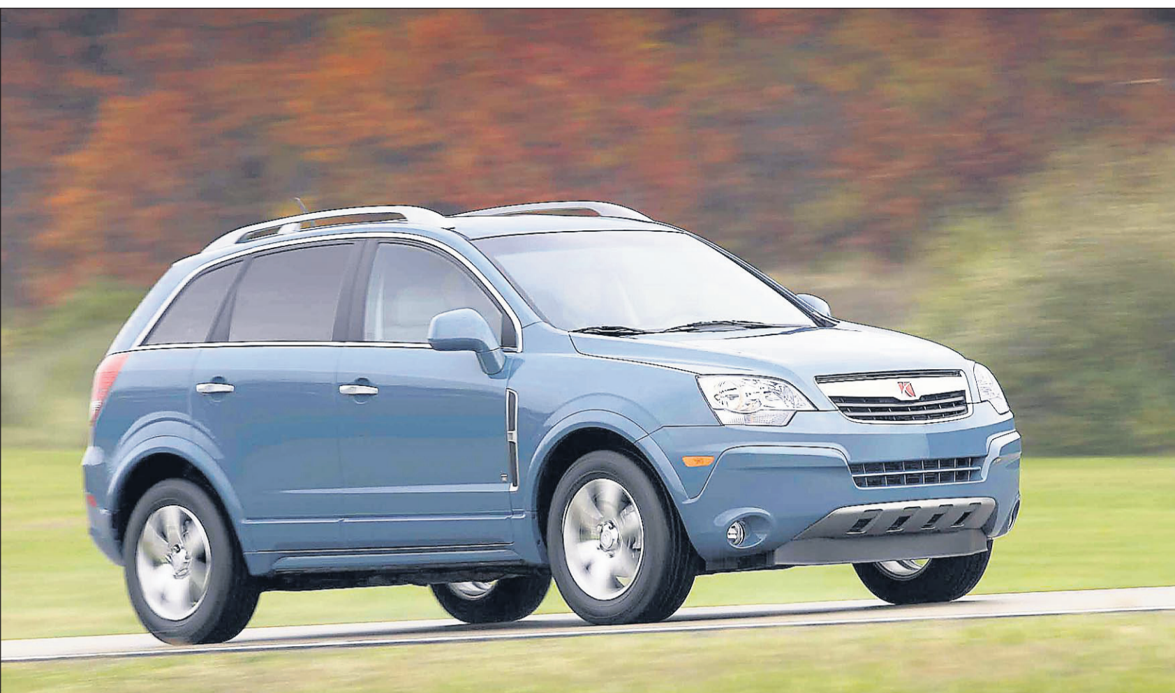
Le Saturn Vue XR