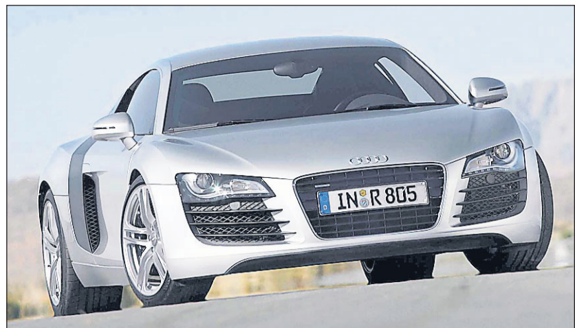
La R8 de Audi a des airs d'italienne.

Cette dernière production d'Émilie-Romagne sera disponible en quatre couleurs : jaune, orange, gris et noir. Pour se démarquer, la Superleggera adopte un imposant aileron et des jantes spécifiques. Peut-être songerez-vous toutefois à laisser tomber l'italienne au profit de la nouvelle version de la Dodge Viper. Encore cette année, elle repousse les limites de la puissance. Au programme, un V10 (8,4 litres!) qui produit 600 chevaux. De quoi passer de 0 à 100 km/h en moins de quatre secondes et de 0 à 160 en... 12 secondes! Démentiel.