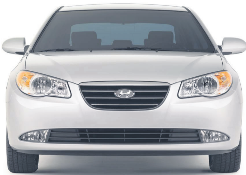
(MODÈLE ELANTRA GLS MONTRÉ)