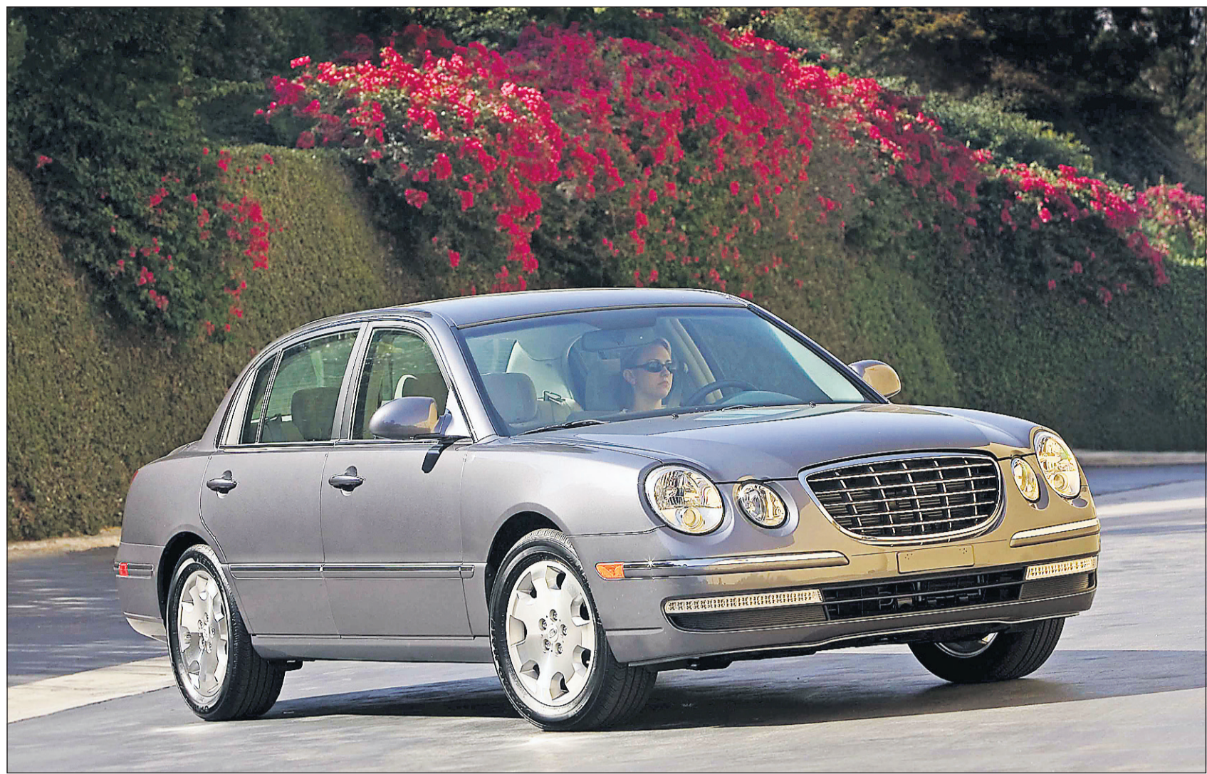
L'Amanti de Kia ressemble beaucoup au modèle précédent. Pour mesurer l'importance des changements, il faut impérativement ouvrir les portières.

À la surprise générale, le mois dernier, Ford a décidé de remettre au catalogue une voiture qui portera le nom de Taurus. Il ne s'agira pas d'un nouveau modèle, cependant. En effet, Ford a décidé de rebaptiser du nom de Taurus sa berline Five-Hundred qui, depuis son lancement il y a deux ans, n'est jamais véritablement parvenue à sortir de l'anonymat. Selon plusieurs analystes, la Taurus a largement contribué au sauvetage de Ford il y a une vingtaine d'années, notamment en raison de son allure avant-gardiste. Outre le changement d'appellation, la future Taurus arborera une calandre plus dynamique que l'actuelle Five-Hundred, ainsi qu'une motorisation plus puissante.