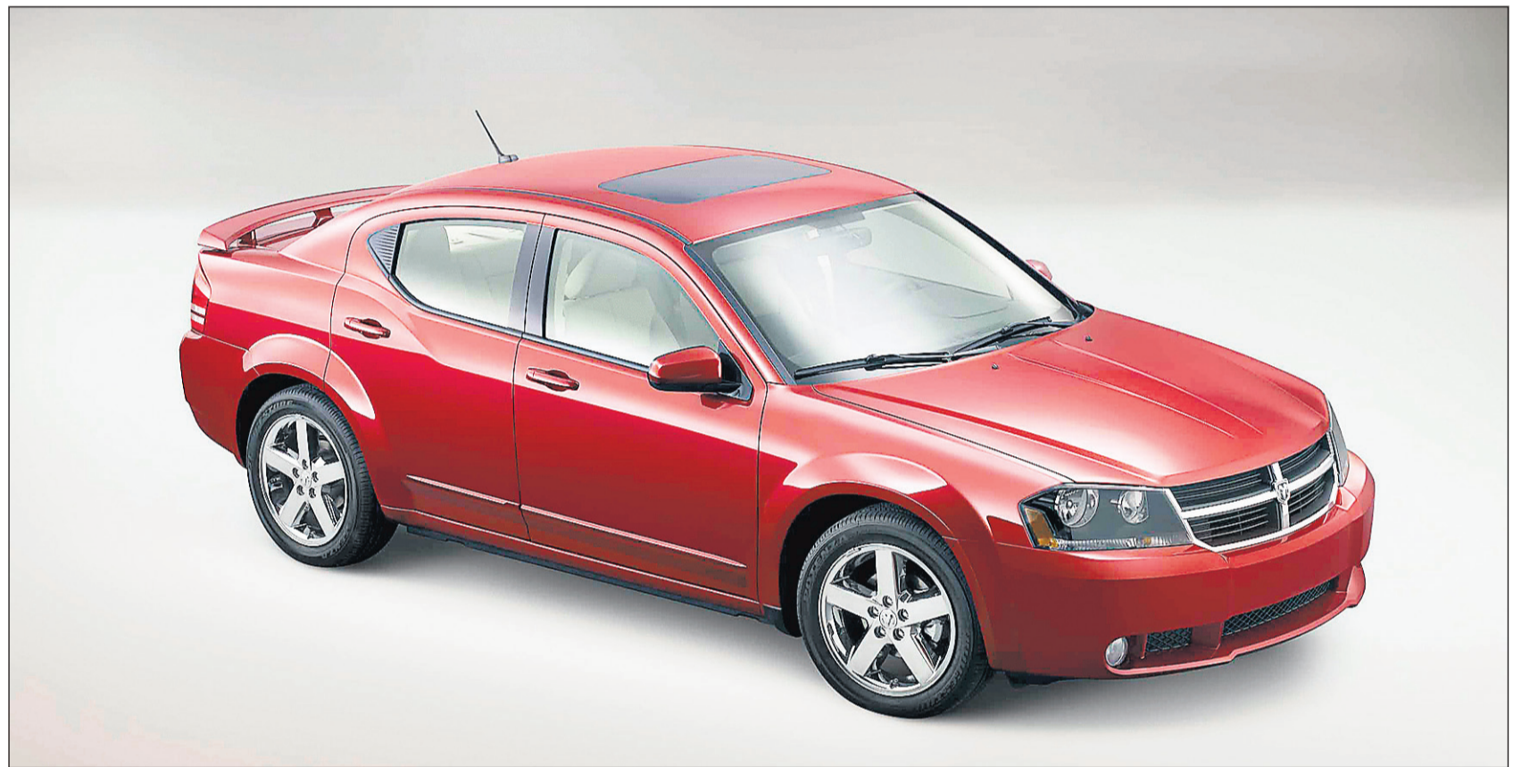
L'Avenger témoigne du désir de Dodge de diversifier son offre.