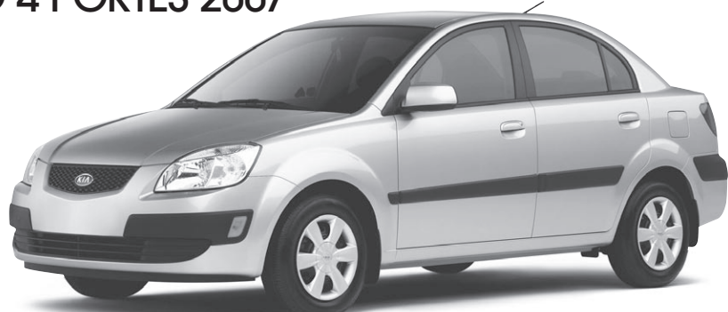
Modèle EX illustré*