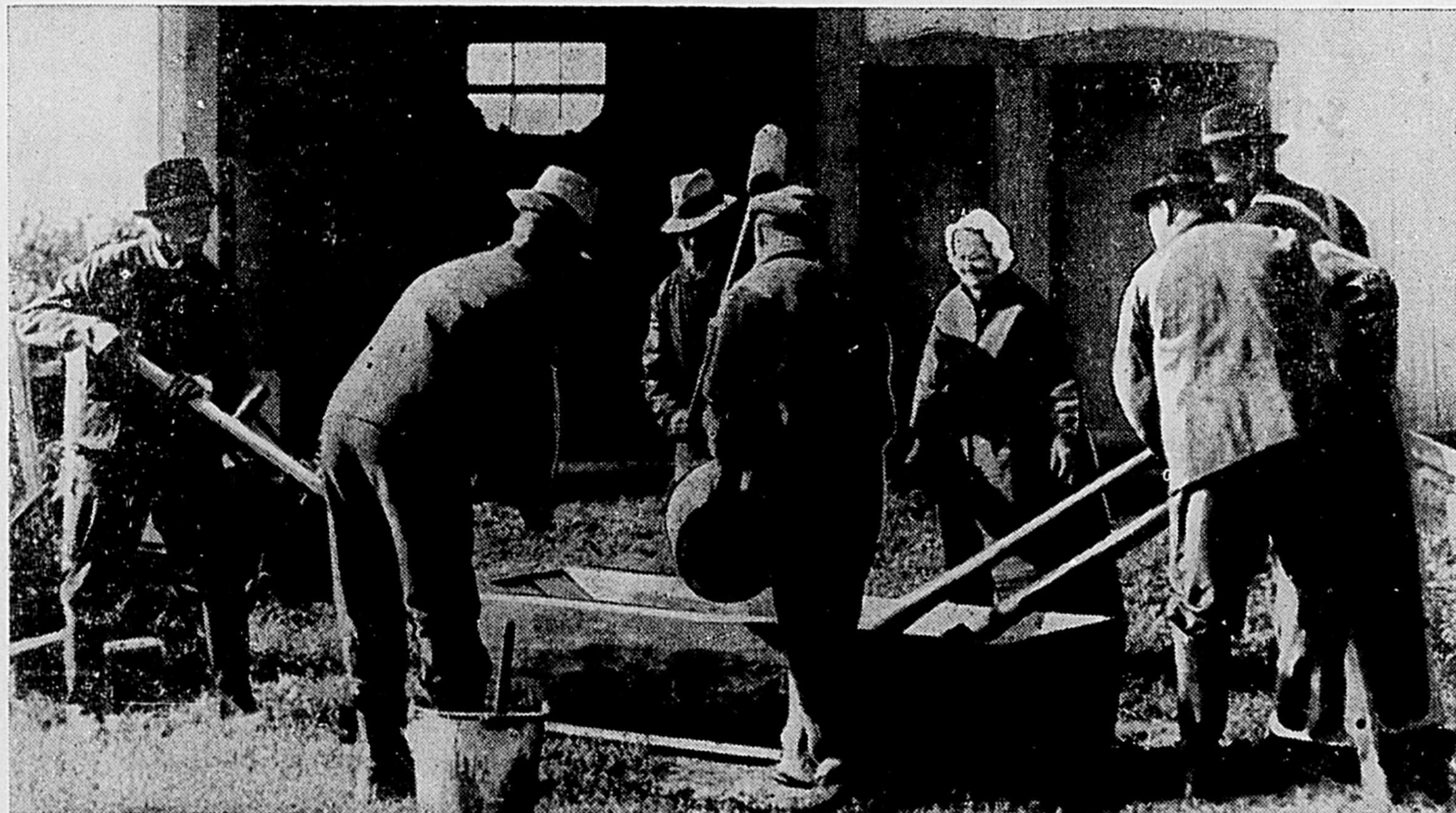
Pionniers de l'industrie croissante du lin dans le Québec

Connaissez-vous le Québec? Savez-vous, par exemple, que 75% de la fibre de lin du Canada est cultivée dans le Québec? Quelque 30,000 acres et plus d'une vingtaine de moulins de transformation sont consacrés à son développement. Comme beaucoup d'autres récoltes, celle du lin contribue à la production agricole qui se chiffre annuellement à $200,000,000—15% du total national!