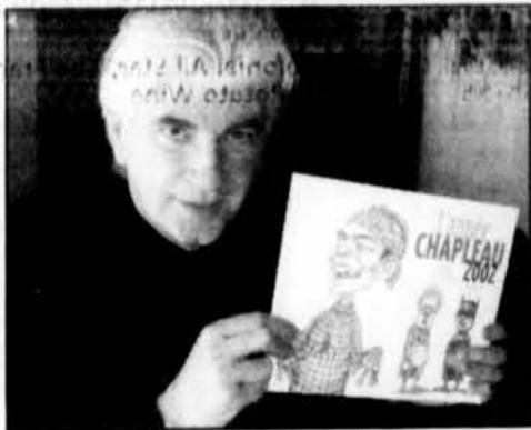
Serge Chapleau.

Si bien que M. Chapleau porte le chapeau de caricaturiste 24 h sur 24. «C'est un travail «full time». Je n'arrête jamais d'y penser, d'écouter les actualités, d'échanger avec les gens en vue de préparer ma prochaine caricature». Car M. Chapleau se défend bien d'exprimer uniquement son idée à travers ses caricatures. «J'ose espérer que j'exprime avec humour l'opinion de la population en général», confie ce dernier. Question de bien saisir de quoi le public parle présentement, Serge Chapleau sort, se promène et surtout écoute ce que disent les gens autour