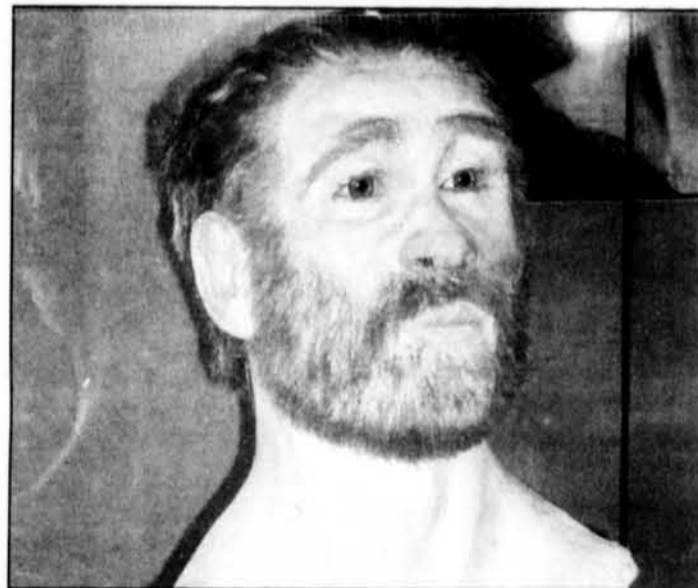
L'exposition comprend quelque 400 artefacts aussi fascinants les uns que les autres.

«Le mystérieux peuple des tourbières», au Musée canadien des civilisations jusqu'au 1 er septembre 2003.