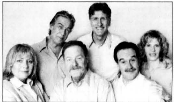
L'équipe de comédien de la pièce «Les Sunshine Boys» présentée les 13 et 14 décembre au Collège de l'Outaouais.