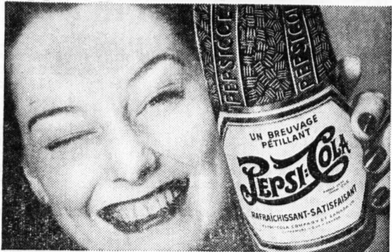
"Pepsi-Cola" est la marque enregistrée au Canada de Pepsi-Cola Company of Canada, Limited EMBOUEILLÉ PAR

MARIUS BOURQUE, Vallée-Jonction, Qué. Avec autorisation spéciale