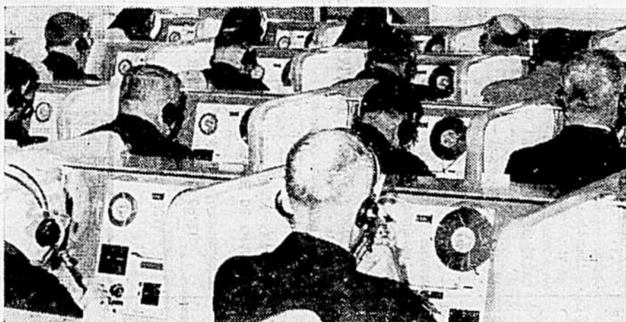
Une partie du Laboratoire Edwards de langue parlée du Séminaire de Rimouski.

LA METHODE LA PLUS EFFICACE POUR L'ENSEIGNEMENT DES LANGUES