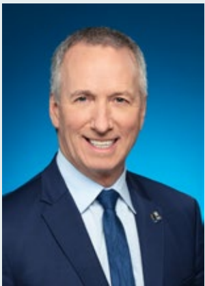
Le ministre de l'Agriculture, des Pêcheries et de l'Alimentation

L'observation des protocoles dans les situations particulières de chaque entreprise, autant dans les usines de transformation qu'à bord des bateaux, est un défi important et elle est essentielle à la poursuite des activités. Les prochaines semaines et les prochains mois nous permettront de voir quelles leçons retenir de cette crise. Pour terminer, j'aimerais souligner la rapidité avec laquelle l'industrie a réagi face à la COVID-19 ainsi que la proactivité et l'esprit de collaboration que vous avez montrés dans la recherche de solutions au cours des dernières semaines. Nous sortirons de cette période trouble unis, résilients et plus forts.