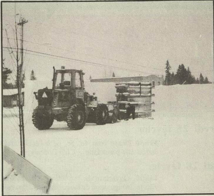
#1 Les gars de la voirie à l'ouvrage!