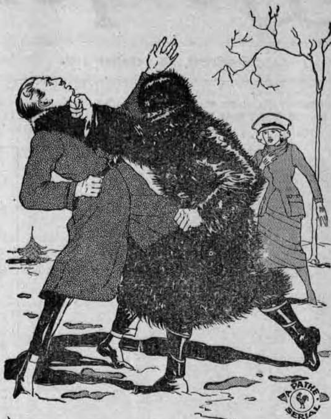
L'homme masqué ressemblait à l'oncle Léo.