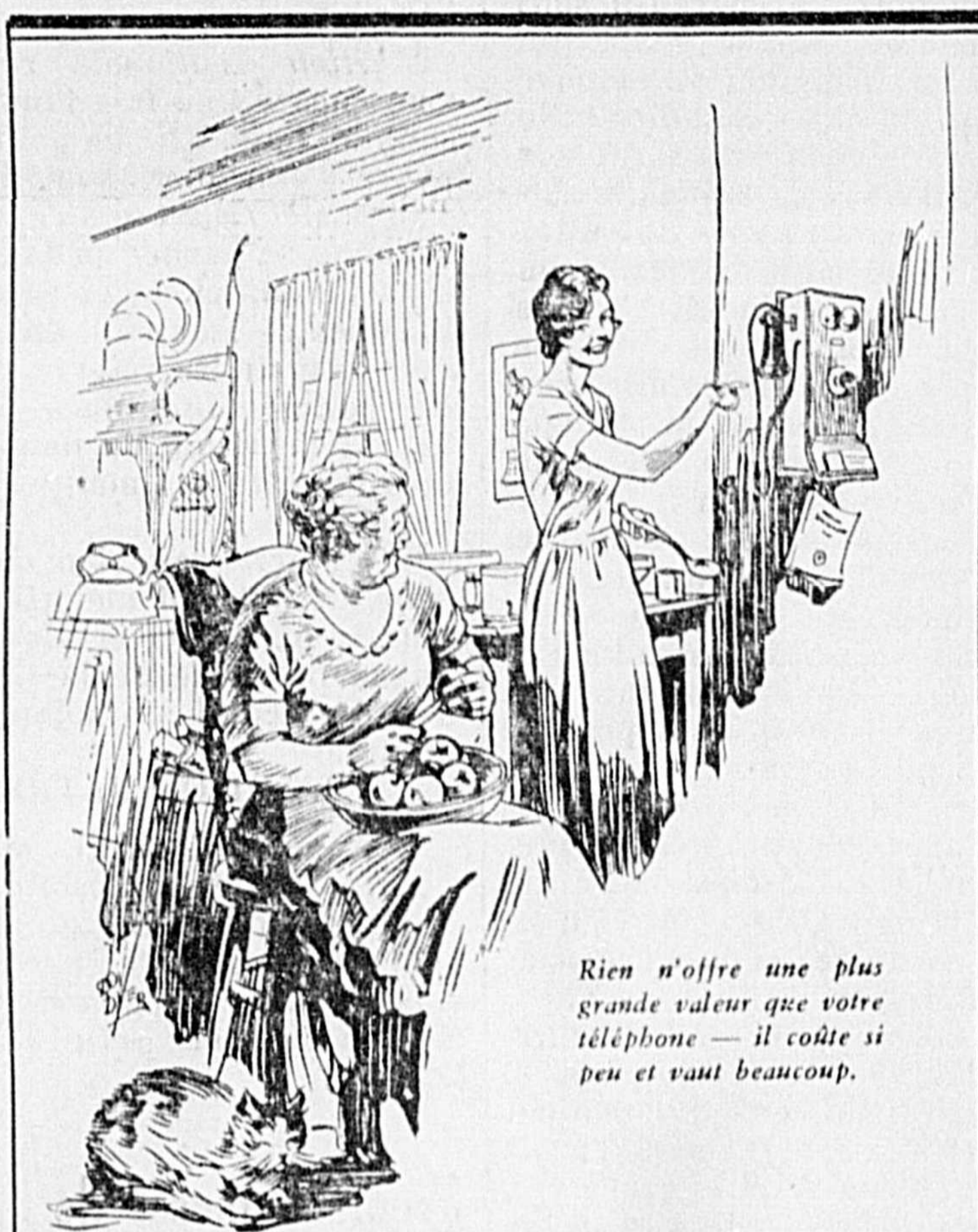
Rien n'offre une plus grande valeur que votre téléphone — il coûte si peu et vaut beaucoup.

TÉL. 775 NOIR, 914 J.-ERNEST ST-ONGE ENTREPRENEUR-ÉLECTRICIEN BRULEURS A L'HUILE NU-WAY 248 CASCADES ST-HYACINTHE