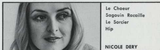
Le Choeur Sagouin Racaille Le Sorcier Hip