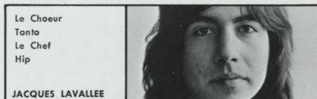
Le Choeur Tonto Le Chef Hip