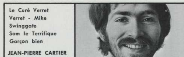
Le Curé Verret Verret - Mike Swinggate Sam le Terrifique Garçon bien