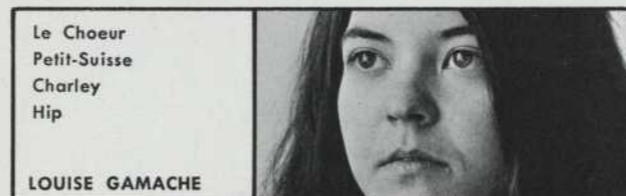
Le Choeur Petit-Suisse Charley Hip