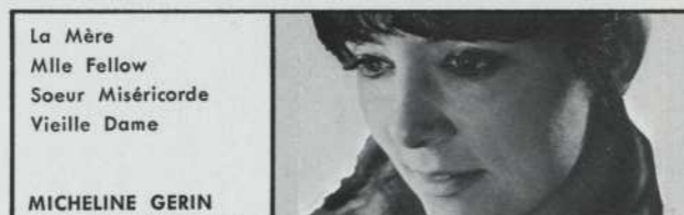
La Mère Mlle Fellow Soeur Miséricorde Vieille Dame