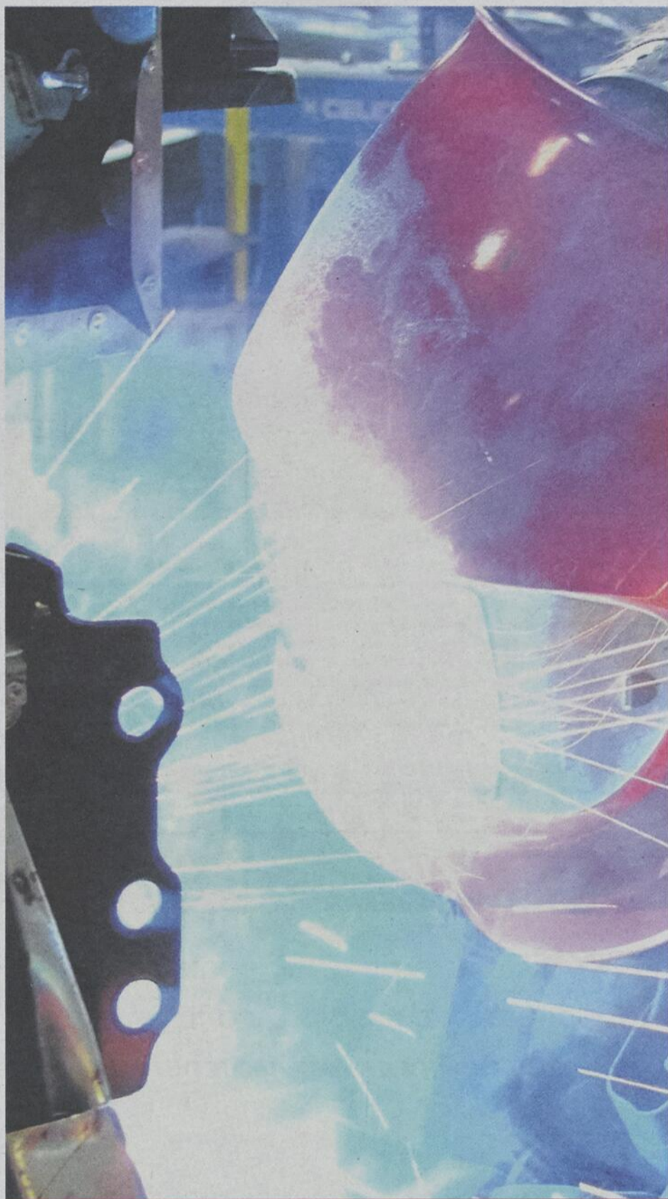
Dans le secteur manufacturier, les impacts du vieillissement de la population se font ressentir depuis déjà quelques années.

Notons enfin qu'en date de l'année 2011, la MRC Les Moulins occupait le 4e rang du plus haut taux de travailleurs des MRC et territoires équivalents du Québec, avec un taux exceptionnel de 83,5 %. Pour connaître les perspectives d'emploi des différents secteurs d'activité dans la région, visitez le imt.emploiquebec.net .