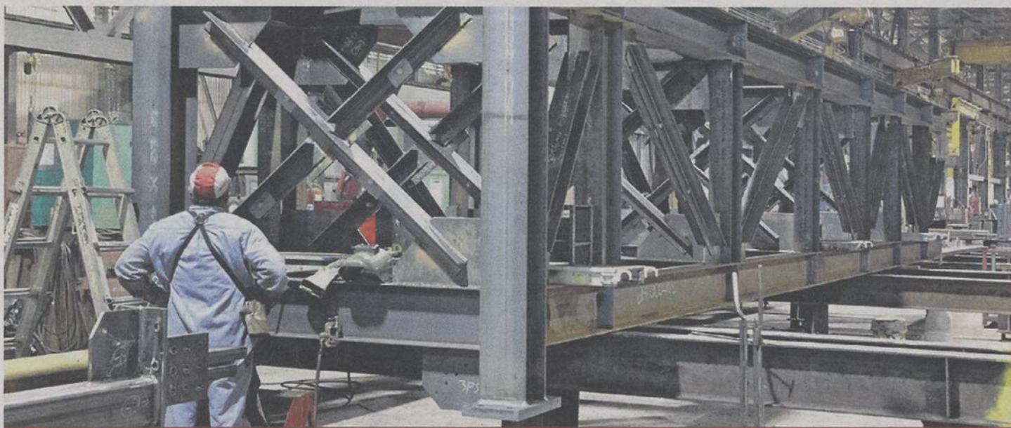
Le Groupe ADF a remporté l'appel d'offres du prestigieux contrat de la conception de la structure d'acier du futur amphithéâtre de Québec, un mandat de 46,6 M$.

Ce contrat remporté par le Groupe ADF est le plus important de l'ensemble des contrats qui seront octroyés dans le cadre du chantier du futur amphithéâtre de Québec. Les travaux de conception de la structure d'acier devraient débuter