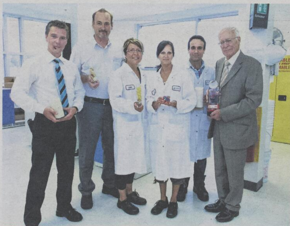
L'emploi n'a cessé de croître dans la MRC Les Moulins, entre autres grâce à la création d'emplois dans plusieurs entreprises, notamment Tergel de Terrebonne, dont on reconnaît ici une partie de l'équipe de direction. Tergel est une des industries participant au Salon de l'emploi 2013.

S i pour vous, les mois de janvier et février sont synonymes de changement, une visite au Salon de l'emploi des Moulins s'impose, d'autant plus que notre région détient un taux de chômage très bas.