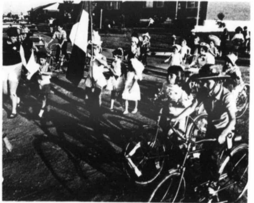
Le drapeau est peut-être celui de la France, mais qu'est-ce que cela peut faire. Après tout, on nous a enseigné à l'école que les Français étaient nos cousins.

Louez... Une machine à écrire ou à additionner Réparation de toutes marques Tout pour le bureau Samson Équipement de Bureau Inc. 8988 est, rue Sherbrooke, Montréal. 352-8629