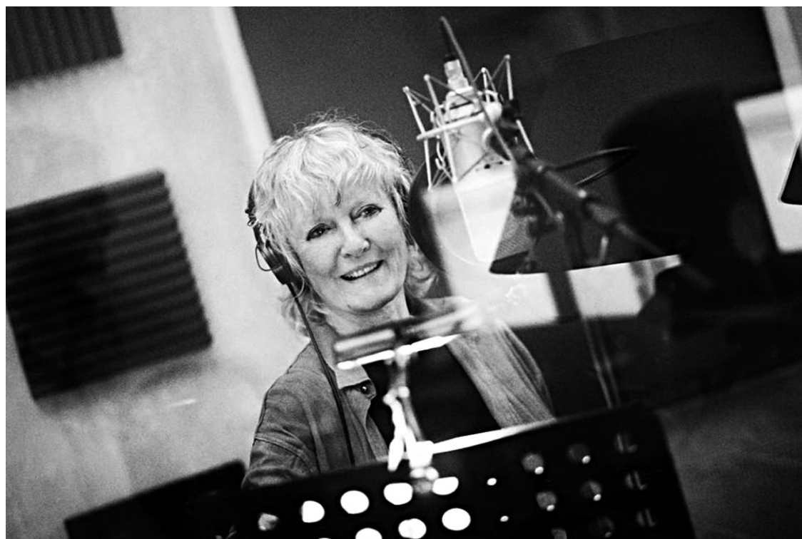
Sessions d'enregistrement à Londres avec une équipe anglaise very modern, sessions grand chic à Paris, on n'a lésiné sur rien pour le nouvel album de Petula Clark.