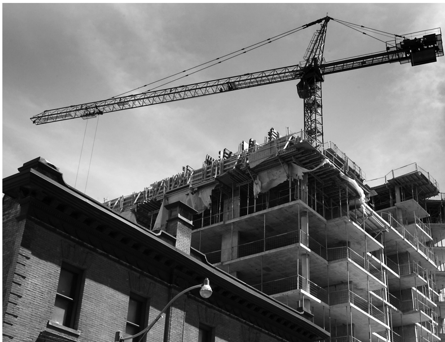
Toronto, l'un des marchés canadiens où la surchauffe immobilière continue de se faire sentir.