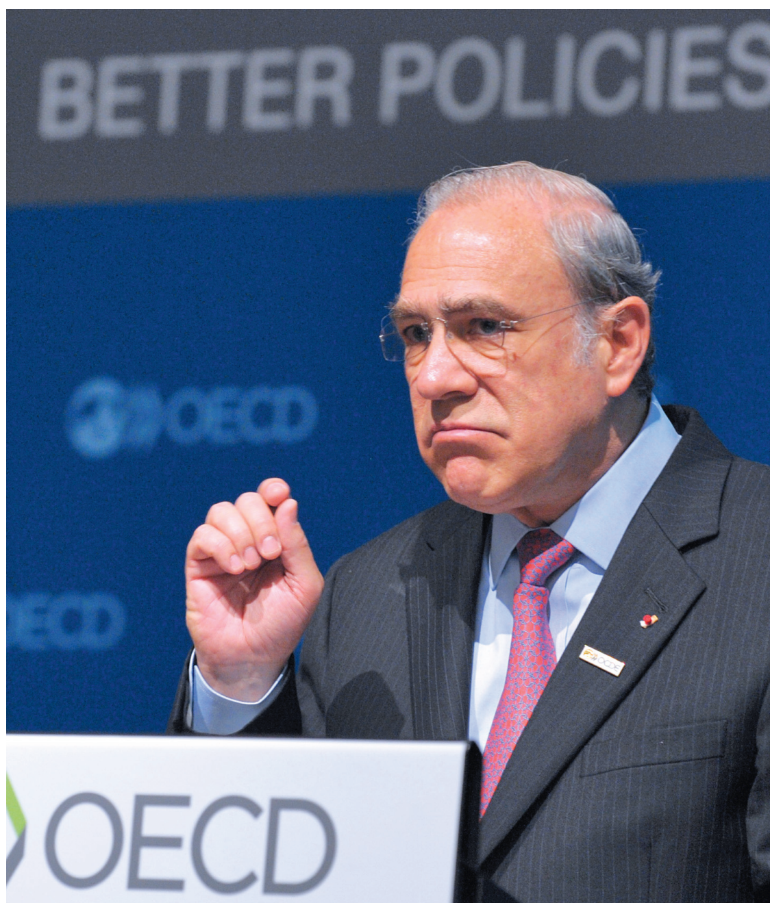
Angel Gurría: « Si les marchés réclament 50 milliards, mettez 100 milliards. »

L'économiste en chef déplore une expansion dans les pays « en meilleure santé » de la zone euro « bienvenue mais insuffisante » pour contrebalancer une croissance « plate ou négative » ailleurs. Il suggère donc de procéder à des « ajustements structurels » et à « une hausse des salaires » dans les pays jouissant d'excédents afin de « contribuer à un rééquilibrage favorable à la croissance ».