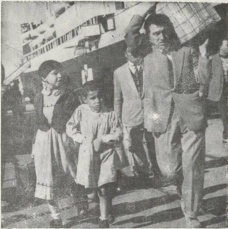
Des immigrants débarquent en Israël . . .

tion nouvellement immigrée. De plus, des classes secondaires ont été organisées selon le système des cours du soir, en collaboration avec l'organisation de la jeunesse ouvrière, pour les jeunes gens qui doivent travailler pendant la journée, et désirent continuer leurs études. Enfin, 3,000 personnes suivent les cours par correspondance créée par l'Histadrut, et dont le programme comprend des cours d'Hébreu, d'études secondaires générales, et des branches commerciales, techniques et agricoles.