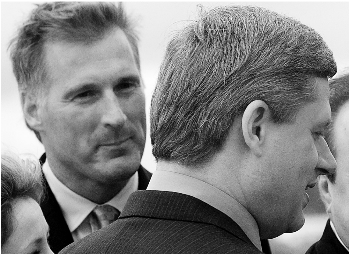
Le premier ministre Stephen Harper ne veut pas d'un autre incident comme celui dans lequel a été impliqué Maxime Bernier au printemps 2008.