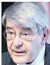
L'auteur est neurologue à l'Institut neurologique de Montréal.

J'ai lu avec intérêt l'article intitulé « Tolérance zéro pour les déficits d'hôpitaux », publié le 30 décembre dans La Presse . Je travaille depuis 40 ans dans un CHU, comme médecin spécialiste, et cette initiative – de vouloir contrôler les déficits – demeure un thème récurrent pour l'administration publique. La dernière en date, celle de Lucien Bouchard, avait été une catastrophe, plaçant le système dans un état d'étirement maximal, soutenu à bout de bras par les médecins au détriment des malades, malgré les prétentions contraires. Aucun « gras » n'a été éliminé dans les postes administratifs; plus encore, une autre strate administrative a été ajoutée avec la fusion des CHU.