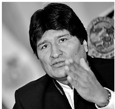
Evo Morales en conférence de presse, hier.

Elle devra réfléchir, selon Morales, à un projet de Déclaration universelle des droits de la «Terre mère», à un projet de «référendum mondial» sur un plan de lutte contre les changements climatiques et à la mise en place d'une «Cour internationale de justice climatique», sujets chers au président bolivien, et qu'il a développés à la conférence de l'ONU de Copenhague en décembre.