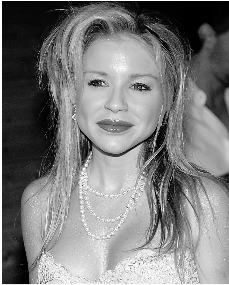
Casey Johnson était connue pour ses frasques et ses excès, qui lui ont valu de faire régulièrement la première page des magazines à potins.