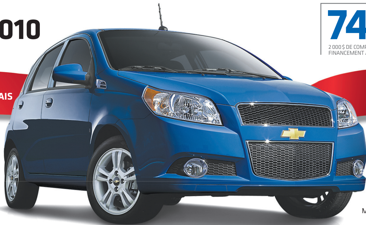
Modèle LT illustré

2 350 $ 4 DE RABAIS INCLUT 1 000 $ DE BONI DES FÊTES