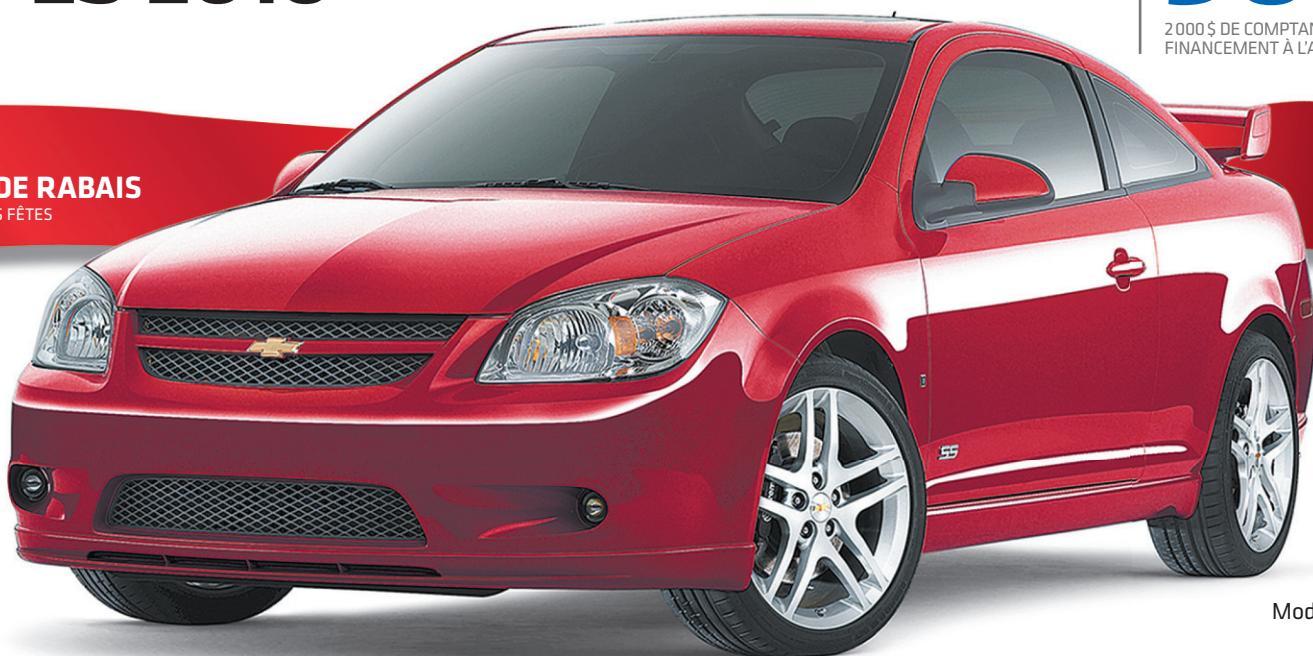
Modèle SS illustré

1 850 $ 4 DE RABAIS INCLUT 1 000 $ DE BONI DES FÊTES