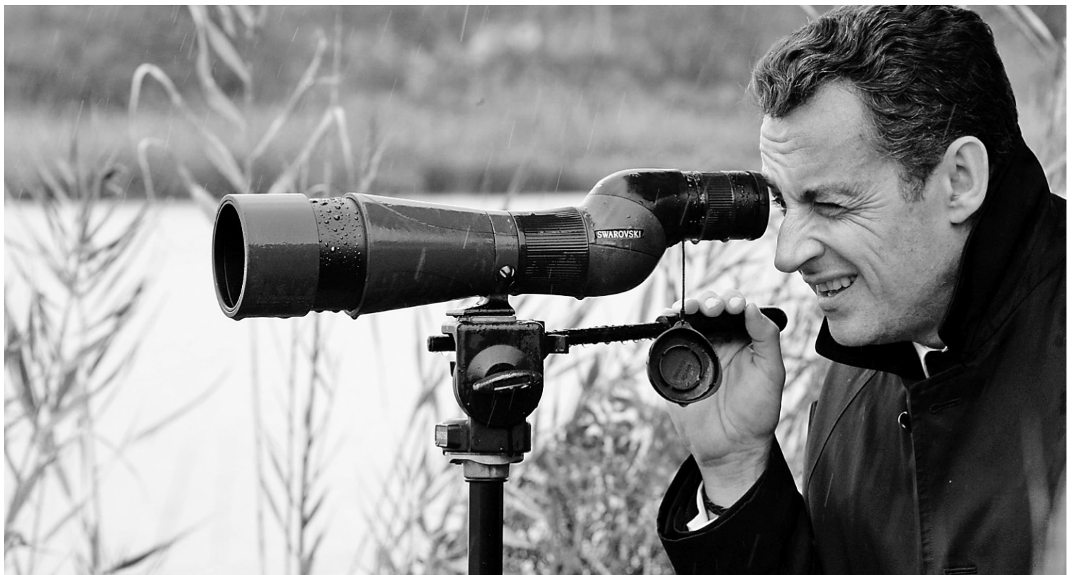
Nicolas Sarkozy a observé les oiseaux dans le sanctuaire de Biguglia, en Corse, l'automne dernier. Après l'échec de la taxe carbone au Conseil constitutionnel, le président français a ajusté son tir. Il souhaite qu'un nouveau projet de loi soit présenté le 20 janvier.