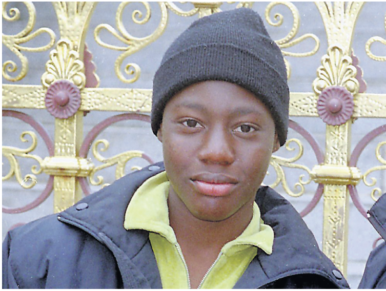
Umar Farouk Abdulmutallab, 23 ans, aurait réussi à déjouer les systèmes de renseignement et de sécurité américains le 25 décembre.

Le président Obama fait des reproches aux services de sécurité