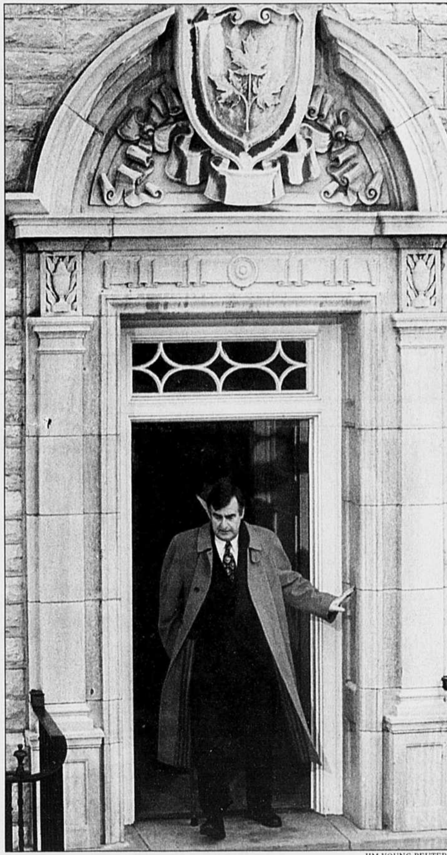
Le premier ministre du Québec, Lucien Bouchard, a quitté Ottawa sans signer l'accord sur l'union sociale. La clause du droit de retrait des programmes fédéraux aurait constitué, selon lui, «un recul très grave» pour le Québec. S'il acceptait cette clause, le Québec sanctionnerait des initiatives fédérales comme les bourses du millénaire.

Les autres premiers ministres ont tenté de minimiser l'isolement du Québec mais le malaise était évident à la sortie de la rencontre. «Il n'y a pas de gouvernement qui