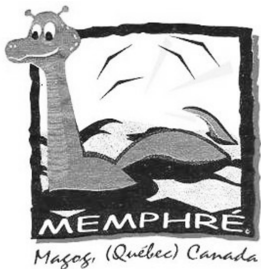
La mascotte du centre-ville de Magog

Au Vermont, une résolution a été adoptée en 1987 afin de conférer à Memphré la double citoyenneté, et en 2011, le Canada a frappé une pièce de monnaie à son effigie.