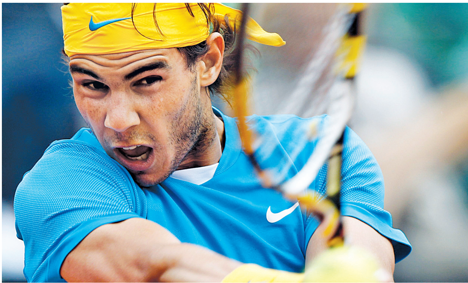
Rafael Nadal en pleine action, hier à Rome

Après un sixième couronnement de rang — sans perdre un seul set — à Monte Carlo, le Majorquin a enlevé son cinquième titre sur la terre battue du Foro Italico en six participations, ne cédant qu'une seule manche au Letton Ernest Gulbis en demi-finale. Au cours d'une finale — première 100 % espagnole — interrompue deux fois par la pluie, Nadal, numéro 3 mondial, n'a été inquiété par son compatriote David Ferrer qu'au