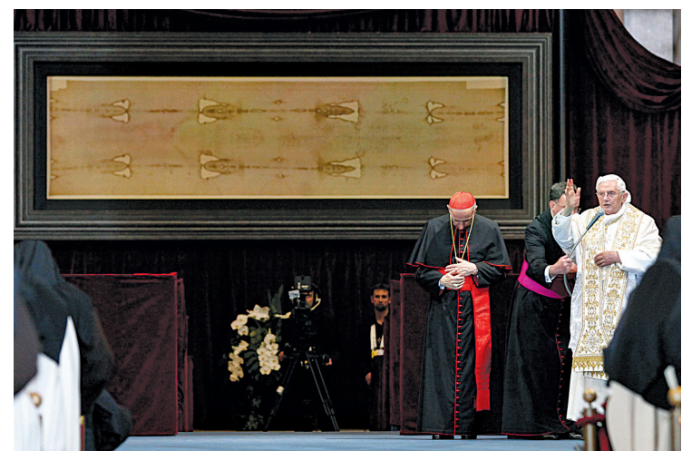
Le pape Benoît XVI devant le saint suaire, hier, à la cathédrale de Turin.