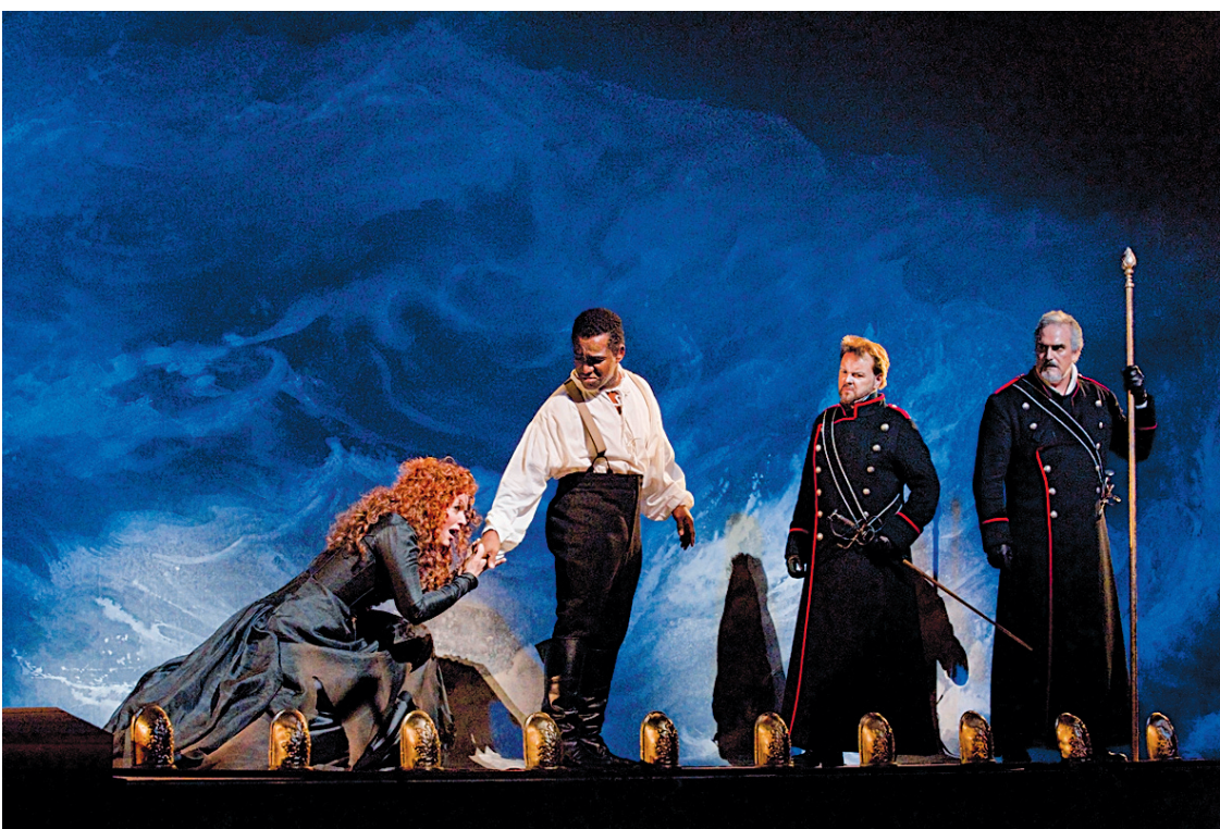
Renée Fleming (Armida) et Lawrence Brownlee (Rinaldo) dans la production du MET