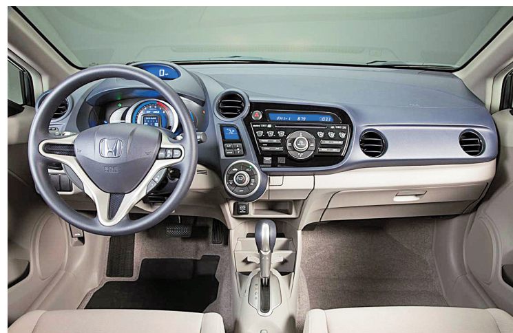
Le tableau de bord à deux paliers, façon Civic, ne fait pas l'unanimité, mais la vue est imprenable et la lecture des cadrans, facilitée.