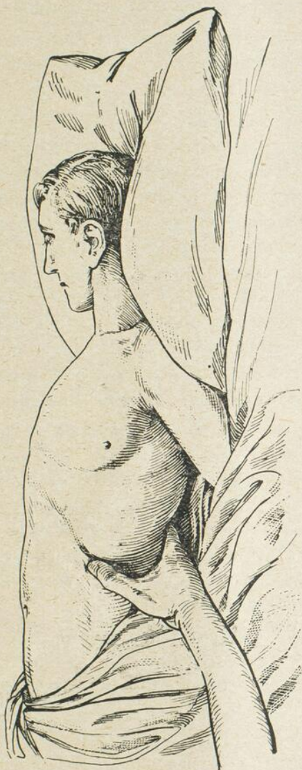
Figure 2: Palper rénal par la méthode de Glénard.

mobilisation se limite au ballonnement et au déplacement respiratoire. La forme générale est arrondie sans bord tranchant. Enfin, la percussion antérieure montre qu'il existe en avant une zone de sonorité , due au refoulement antérieur des côlons. Une insufflation d'air par le rectum mettra en évidence, dans les cas douteux, cette particularité.