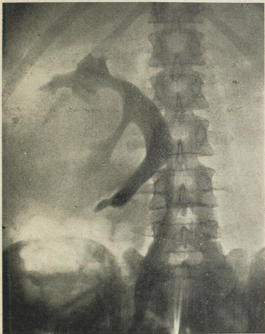
Figure 3: Pyélographie d'un cancer du rein.

malade présente une chute de toutes les éliminations , plus ou moins marquée selon l'étendue du processus cancéreux. La pyélographie fournit une image particulière. Le bassin et l'uretère sont déformés par la masse. Dans les tumeurs du pôle inférieur l'uretère se rap-