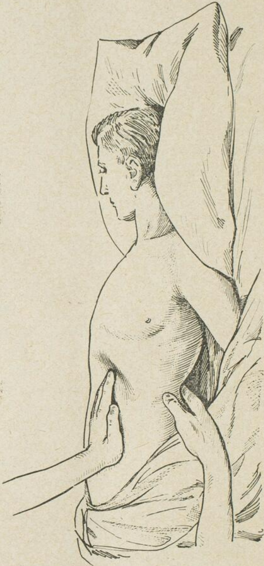
Figure 1: Palper rénal par la méthode de Guyon.

qui permettent de l'identifier. La main postérieure le sent facilement sous forme de plénitude de la région, sans que la main antérieure ne refoule la masse en arrière. Ce premier caractère indique que la tumeur est lombaire . De plus, elle possède le ballotement rénal . La pression en arrière dans la région des lombes la refoule facilement