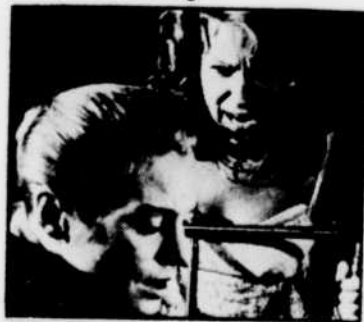
Une scène du «Silence» de Bergman, à «Ciné-club», à 23 h 30.