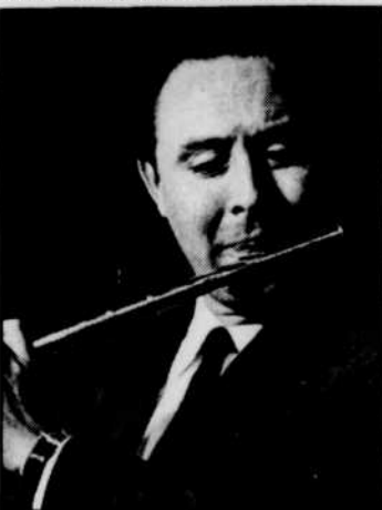
Jean-Pierre RAMPAL jouera un concerto de Mozart, le dimanche 23 à 8 heures, avec l'Orchestre symphonique de Québec.

(AM) Les Mercredis de la musique, 20 h 30