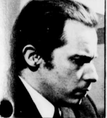
Glenn GOULD, aux «Chefs-d'oeuvre de la musique», MERCREDI à 16 h 30.

(AM et FM) Metropolitan Opera samedi 22, 14 h 00