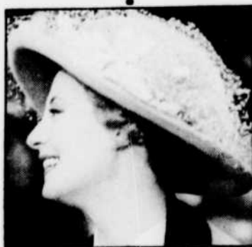
Michèle MORGAN dans «Maxime», à 23 h 30.