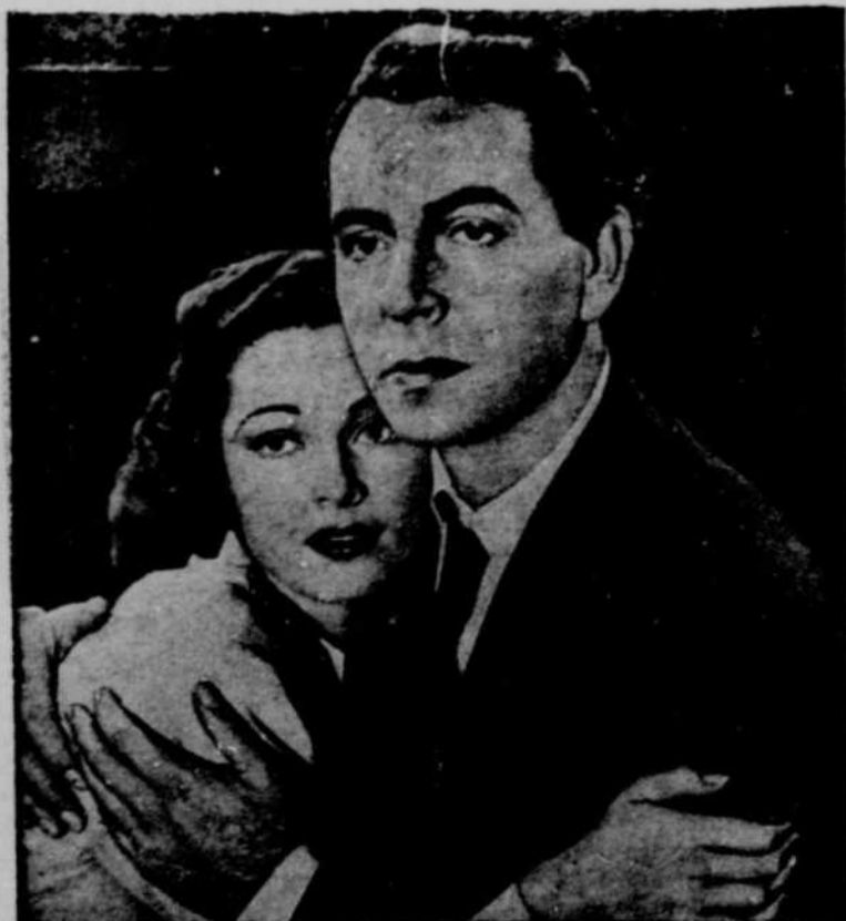
Scène de l'émuovant film "Between Two Worlds" qui sera à l'affiche du Cinéma Cartier, dimanche à mercredi.