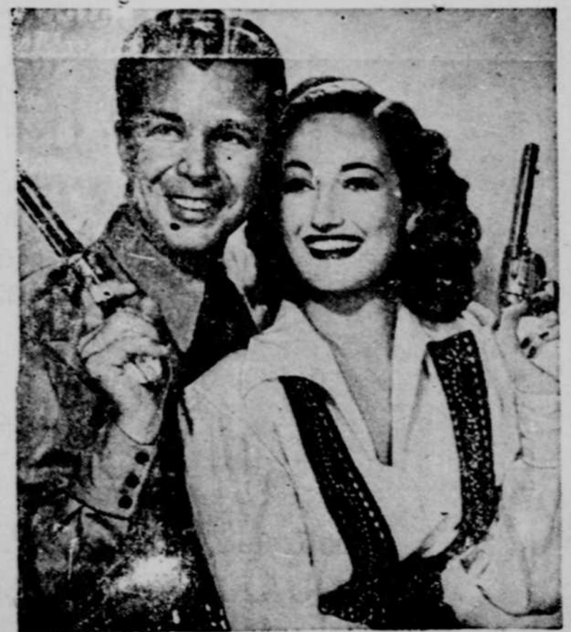
Dorothy Lamour et Dick Powell dans une scène du film en couleurs "Riding High", à l'affiche du théâtre Impérial, pour 2 jours seulement, dimanche et lundi, 23 et 24 juillet.