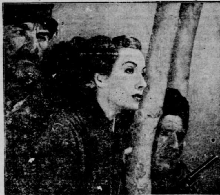
Tamara Toumanova et deux guérillas Russes, dans une scène du film "Days of Glory" à l'affiche du Théâtre Impérial, pour 3 jours, les 25-26-27 juillet.

Pour vérifier les résultats des recherches, conduire certains projets se rapportant à l'exploitation du rucher dans certaines conditions locales et faire des démonstrations sur le matériel et les méthodes modernes, la Division de l'apiculture du Service des fermes expérimentales fédérales, maintient des ruchers d'essais et de démonstration sur les fermes et les stations d'un bout à l'autre du Canada, en plus du rucher central situé à la Ferme expérimentale centrale, Ottawa.