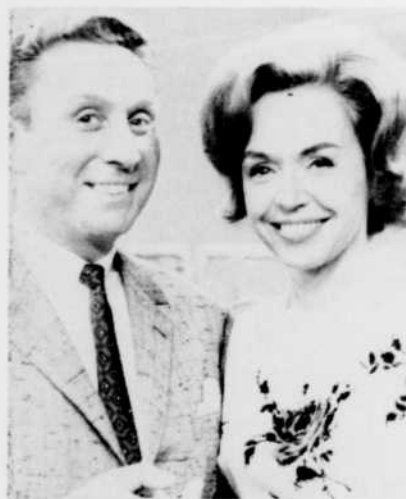
CHARLES TRENET, que l'on voit ici en compagnie de Michelle Tisseyre, interprétera quelques-unes de ses chansons à Rendez-vous avec Michelle, le jeudi 5 juillet à 8 h. 30 du soir.