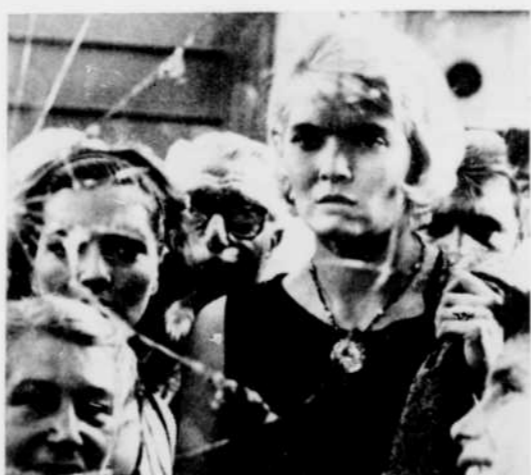
Une scène du film Cléo de 5 à 7 , que nous verrons à Ciné-Club, le 26 juillet à 10 h. 30 du soir.

■ Au cours des mois d'été, tous les jeudis soir à 10 h. 30, le réseau français de télévision ouvre les portes de son Ciné-club à tous les amateurs de films de haute qualité.