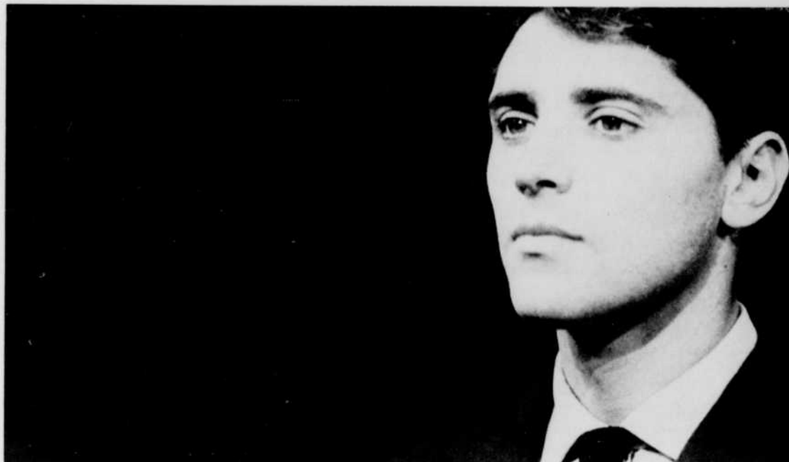
Sacha Distel le séducteur, que tous les amateurs de music-hall connaissent bien. Il inaugurera le 5 juillet, une nouvelle série télévisée, les Grands de la chanson.

...à ceux qui aiment les jeux télévisés: Tic Tac-quin , animé par Louis Morisset, débutera le mardi 10 juillet à 8 h. 30 du soir. Deux équipes de trois comédiens s'affronteront, chaque semaine.