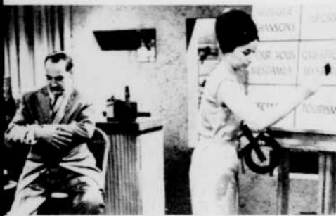
« Tic-Tacquin »

Voilà autant d'émissions qui vous apporteront beaucoup de fraîcheur et de gaieté, au cours des mois d'été.