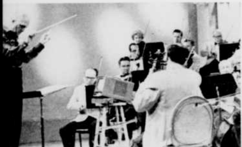
« Sérénade estivale »