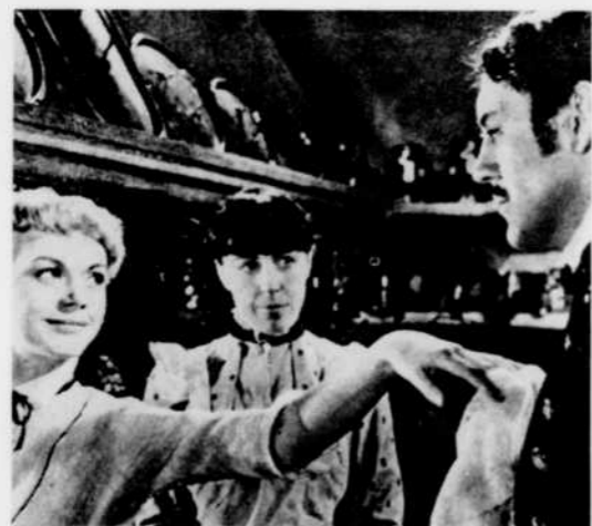
Mademoiselle Julie joue la coquette avec son valet dans le film de Alf Sjöberg présenté le 9 août.