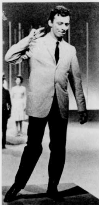
« Qu'il fait bon vivre »