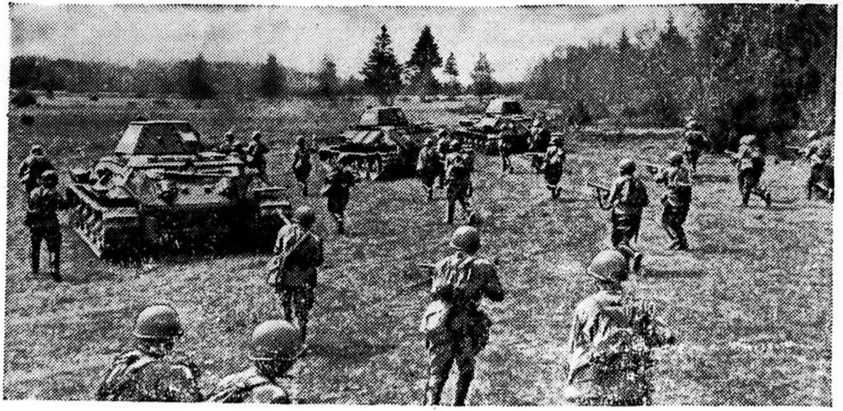
Voici comment l'Armée rouge, la plus héroïque au monde, procède à une attaque sous le couvert des tanks, dans la section de Moscou. Elle a tenu magnifiquement le coup contre les attaques sauvages des légions de Von Bock et se bat sans relâche depuis plus de 60 jours devant Stalingrad.