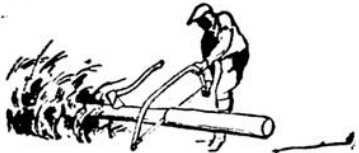
Fig. 11. Bonne manière de placer la bûche pour qu'elle soit à la portée de la main pour continuer à ébrancher.

(la semaine dernière) À SUIVRE APRES L'ABATTAGE Le seul arbre est abattu à la hache ou à la scie. Les bucherons dans le 4 e préfèrent souvent ébrancher et scier chaque bûche à la hache. Assurez-vous que l'ébranchage avance la "butt" vers la "top". Dans les billots, souvent on coupe seulement les branches qui nuisent au sciage et on finit l'ébranchage après; ou bien, on coupe d'abord les branches du dessus de l'arbre, puis après le sciage, celles du dessous. Le choix dépend des conditions du bois, du terrain, etc.