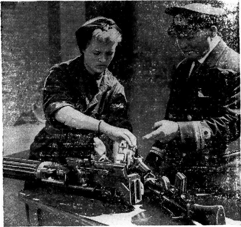
Les "Wrens", comme on appelle les membres du service auxiliaire féminin de la Marine britannique, prêtent main-forte à ceux qui sont chargés de l'entretien des petites embarcations et de leur armement. Cette blonde marinière est en train de nettoyer une mitrailleuse.