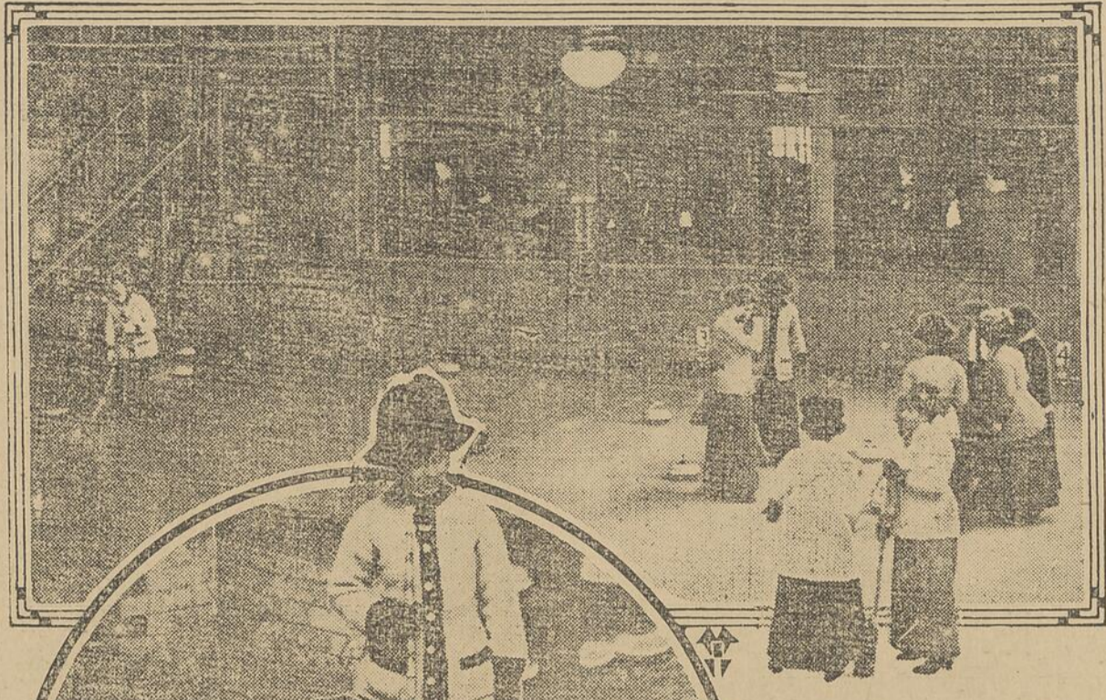
Les dames de Toronto gagnent la partie de championnat contre les dames de Newmarket. Le score fut le suivant : Toronto 5; Newmarket, 4.