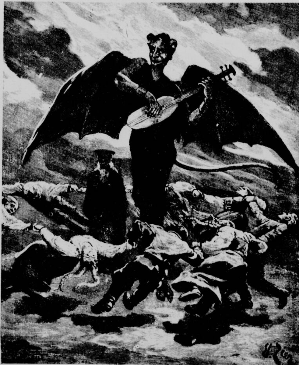
UN ÉCLAIR SILLONNA LA NUE, ET ON VIT SORTIR DE TERRE SATAN EN PERSONNE. — Page 28, col. 2