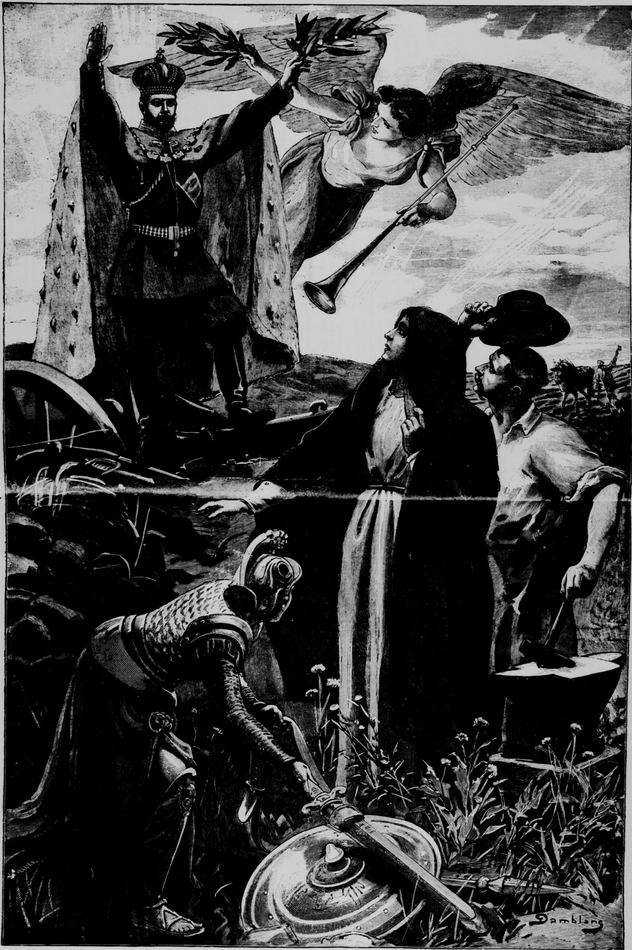
LE TSAR OFFRANT A L'HUMANITÉ LA PAIX.—DESSIN DE DAMBLAN