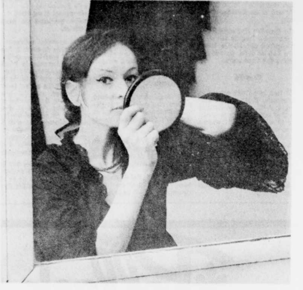
BARBARA QUELQUES INSTANTS AVANT de monter sur scène. Enigmatique et svelte, Barbara a teinté ses chansons d'une mélancolique poésie.