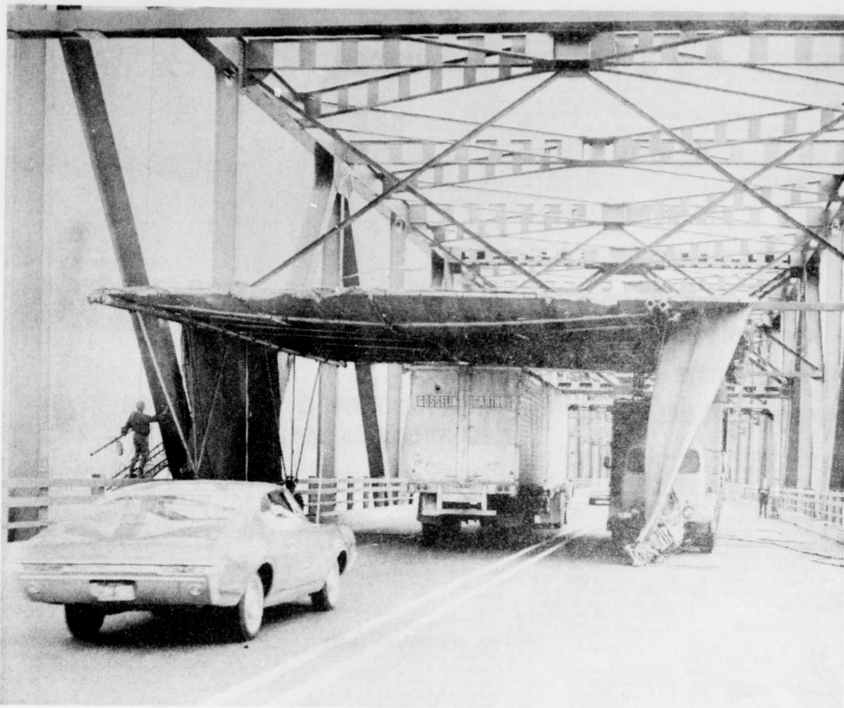
DANS LE BUT DE PROTEGER les automobiles qui circulent sur le pont, les dirigeants de la firme Lagendyk, qui s'est vu confier la réalisation des travaux, utilise ce genre de tunnel en toile sous lequel cir-