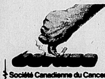
Société Canadienne du Cancer