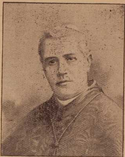
SA SAINTETÉ PIE X.

S. S. Pie X (JOSEPH SARTO), (258 e successeur de saint Pierre) né à Biese, diocèse de Trévise, (Italie), le 2 juin 1835 ; ordonné prêtre en l'église de Castel-Franco, le 18 septembre 1858 ; appelé à la cure de Tobomlo en 1867, et peu de temps après à celle de Salzano ; nommé chanoine de la cathédrale de Trévise en 1875 ; préconisé évêque de Mantoue le 10 novembre 1884 et sacré à Rome, par le cardinal Parocchi ; créé cardinal du titre de Saint-Bernard aux Thermes , le 12 juin 1893 et promu au patriarcat de Venise par Léon XIII, le 15 du même mois ; élu souverain pontife le 4 août 1903 et couronné le dimanche, 9 août 1903.