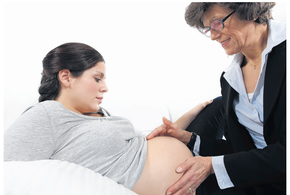
Au cours des prochains mois, des services de sage-femme seront disponibles un peu partout en Gaspésie.

Rappelons que ce service est offert depuis plusieurs années ailleurs au Québec, comme à Montréal, en Montérégie, en Abitibi-Témiscamingue et dans les Territoires Cris. M me Lorraine Fontaine, responsable de la Coalition pour la pratique sage-femme, indique d'ailleurs : « Des groupes citoyens de plusieurs régions du Québec se mobilisent