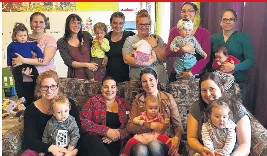
Les marraines d'allaitement, du groupe Lactescence Pabos, sont toutes formées et expérimentées de six mois. Par jumelage, au bout du fil de téléphone, internet ou en personne, elles donnent un soutien moral et technique à la mère, tout en respectant les choix et besoins de celle-ci et de son enfant.

Ajoutons qu'allaiter dans les lieux publics est protégé par la Charte des droits et libertés