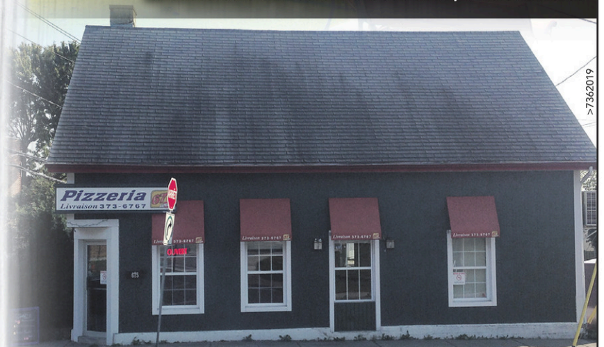
La succursale Express de Pizzeria 67, au centre-ville de Trois-Rivières.