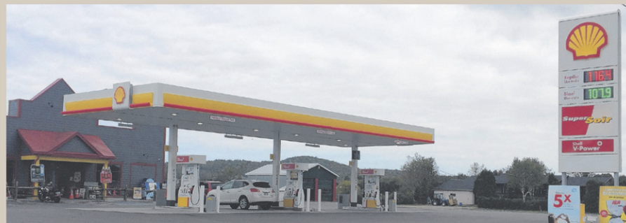
Cet investissement de 1,4 million$ a permis la création d'une dizaine d'emplois.

Selon le jeune homme de 24 ans, le temps était venu pour la municipalité de s'élever au rang de celles contigües en offrant la