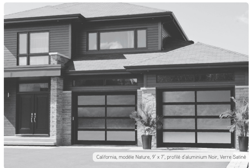
California, modèle Nature, 9' x 7', profilé d'aluminium Noir, Verre Satiné

Pour votre porte de garage, faites affaires avec les vrais experts!