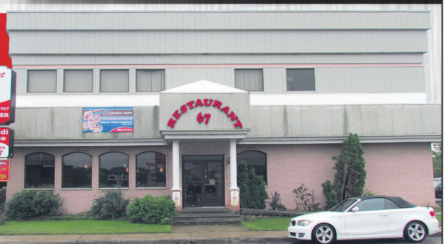
Le Restaurant Pizzeria 67 du Boulevard Thibeau, où tout a commencé.