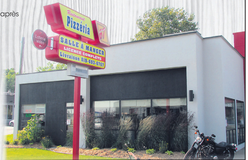
La succursale du boulevard Jean-XXIII, à Trois-Rivières