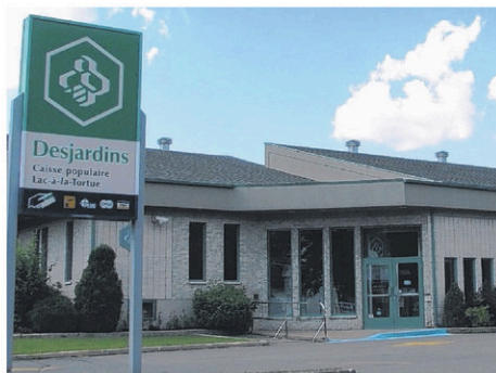
La Caisse populaire de Lac-à-la-Tortue.

Les membres de Lac-à-la-Tortue seront ainsi reconnus dans l'ensemble des centres de services de la Caisse Desjardins du Centre-de-la-Mauricie, laquelle sera en mesure de répondre pleinement à tous leurs besoins financiers.