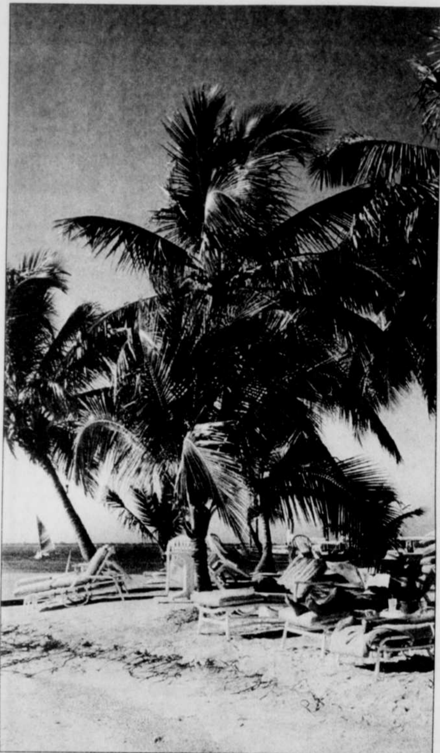
Les ouragans ne semblent pas avoir trop influencé les snoubirds.