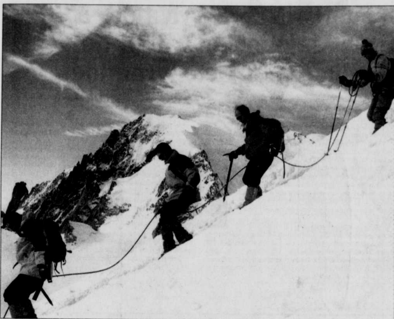
À côté des inconditionnels, adeptes d'une longue et lente préparation, on voit désormais venir des vacanciers à la recherche de sensations nouvelles, moins aguerris, moins au fait des dangers de la montagne.

Plus médiatiques, les morts en montagne ne doivent pas faire oublier que l'on meurt bien plus de noyade (600 par an en France) et sur les routes (près de 8000 morts l'an dernier), pondère le commandant de la CRS Alpes, Raymond Mollaret.