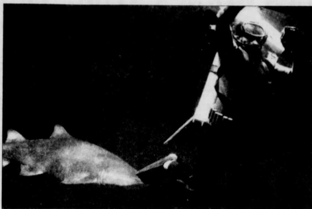
Les amateurs de sensations fortes aiment de plus en plus côtoyer les requins.

Il y a eu cette année une nette augmentation des attaques contre les hommes — 12 contre une moyenne annuelle de 4 —. Mais Compagno pense qu'elle n'est pas significative comparée à l'augmentation phénoménale de la fréquentation humaine de la mer ces dernières années.