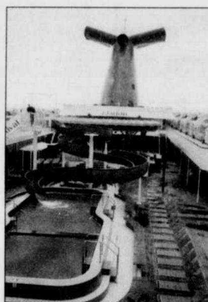
Piscine et glissade d'eau sur le pont supérieur. Par beau temps, petits et grands ne manqueront pas d'apprécier.

Bref, côté météo, c'est l'idéal. Impossible de rêver mieux pour la croisière inaugurale du Elation, dernier-né de la flotte appartenant à Carnival. Du point de vue des organisateurs, s'entend. D'abord, ils s'assuraient de convaincre, sans effort, les incrédules, de la stabilité du paquebot. Personne, apparemment, n'a souffert du mal de mer. Ensuite, leur public n'allait pas faire faux bond. Dieu sait comment les piscines et les bains de soleil, avec l'infini pour horizon, sont tentants. Plus attirants, certainement, que les conférences et visites guidées.