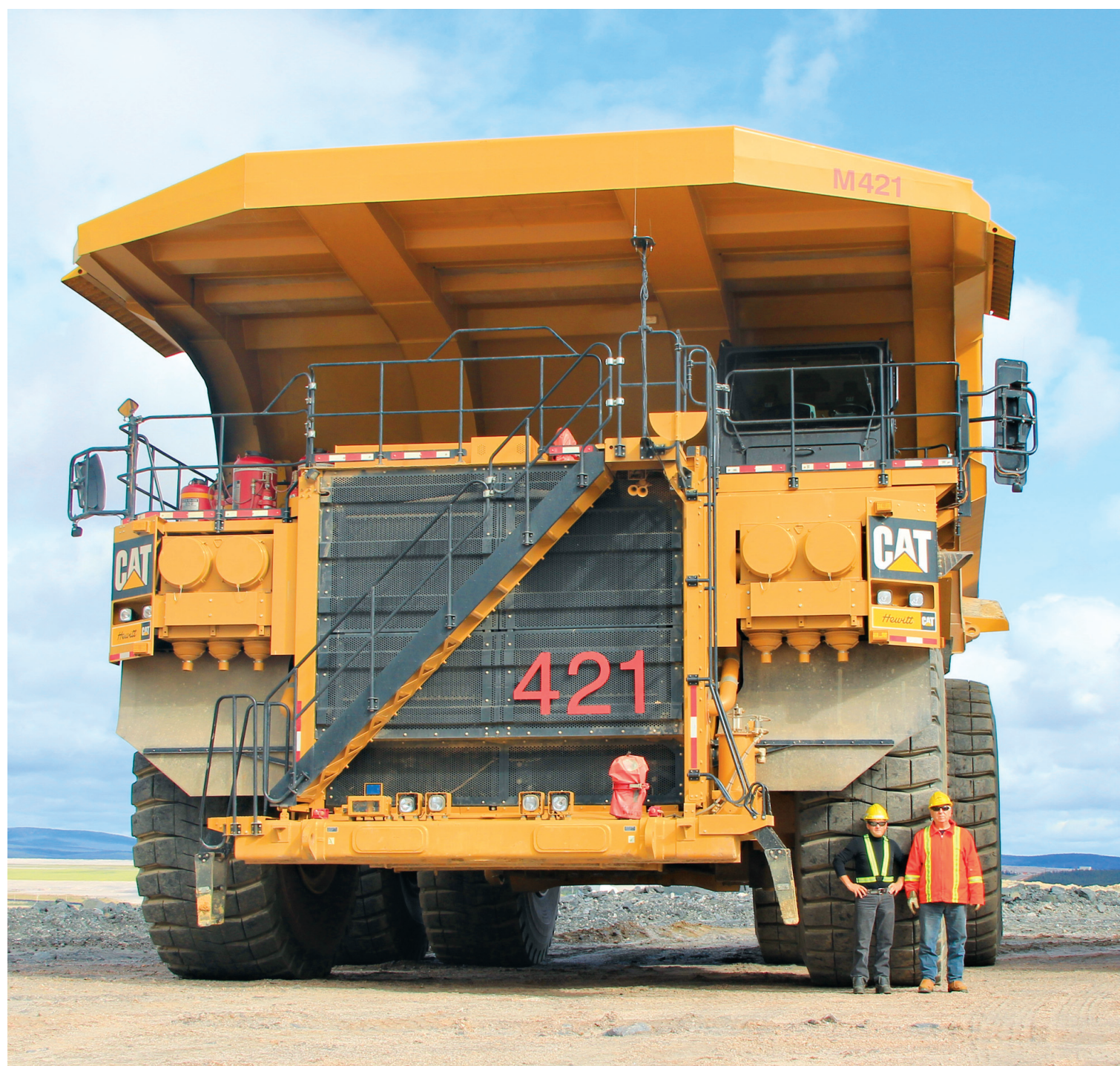
Un des mastodontes qu'utilise ArcelorMittal pour transporter le minerai de fer.

L'aciériste compte sur un portefeuille de plus de 20 mines en activités et en développement et certains médias ont indiqué que la société était prête à vendre une participation de jusqu'à 30% dans sa mine québécoise de MontWright, obtenue lors de sa prise de contrôle de Dofasco, en 2006.