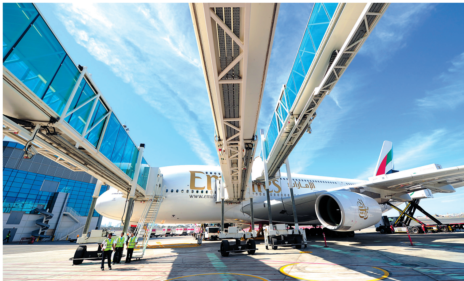
Le terminal pourra accueillir 15 millions de passagers par an.