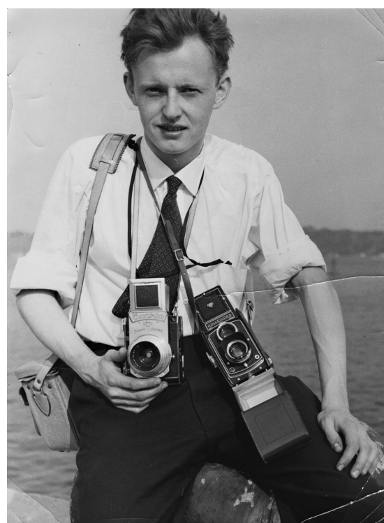
ARCHIVES PERSONNELLES DE GUY BORREMANS