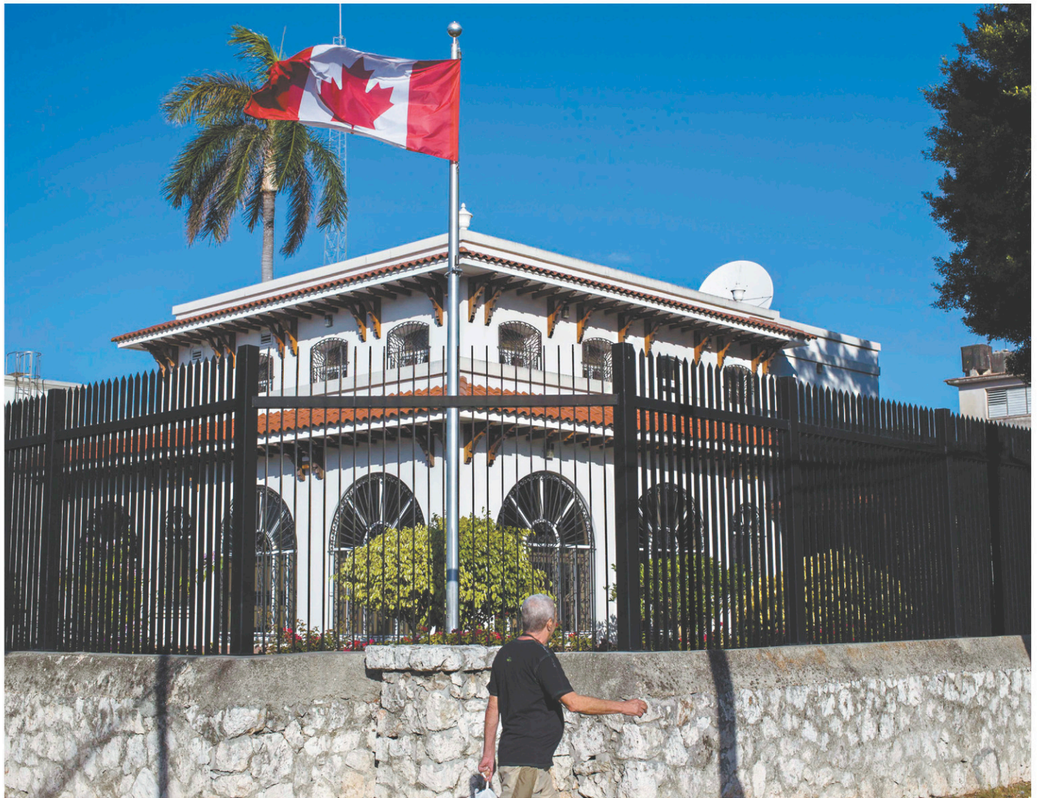
Pas moins de 14 Canadiens ont été affectés d'un mal étrange à la suite d'attaques acoustiques dont on ignore la source.

Fausse piste, assure Ottawa. « Nous avons écarté la possibilité que les grillons soient responsables. Les impacts sont évidents, selon les examens médicaux, et les grillons ne peuvent pas causer ce type d'impact sur la santé », a indiqué une fonctionnaire lors de la séance d'information.