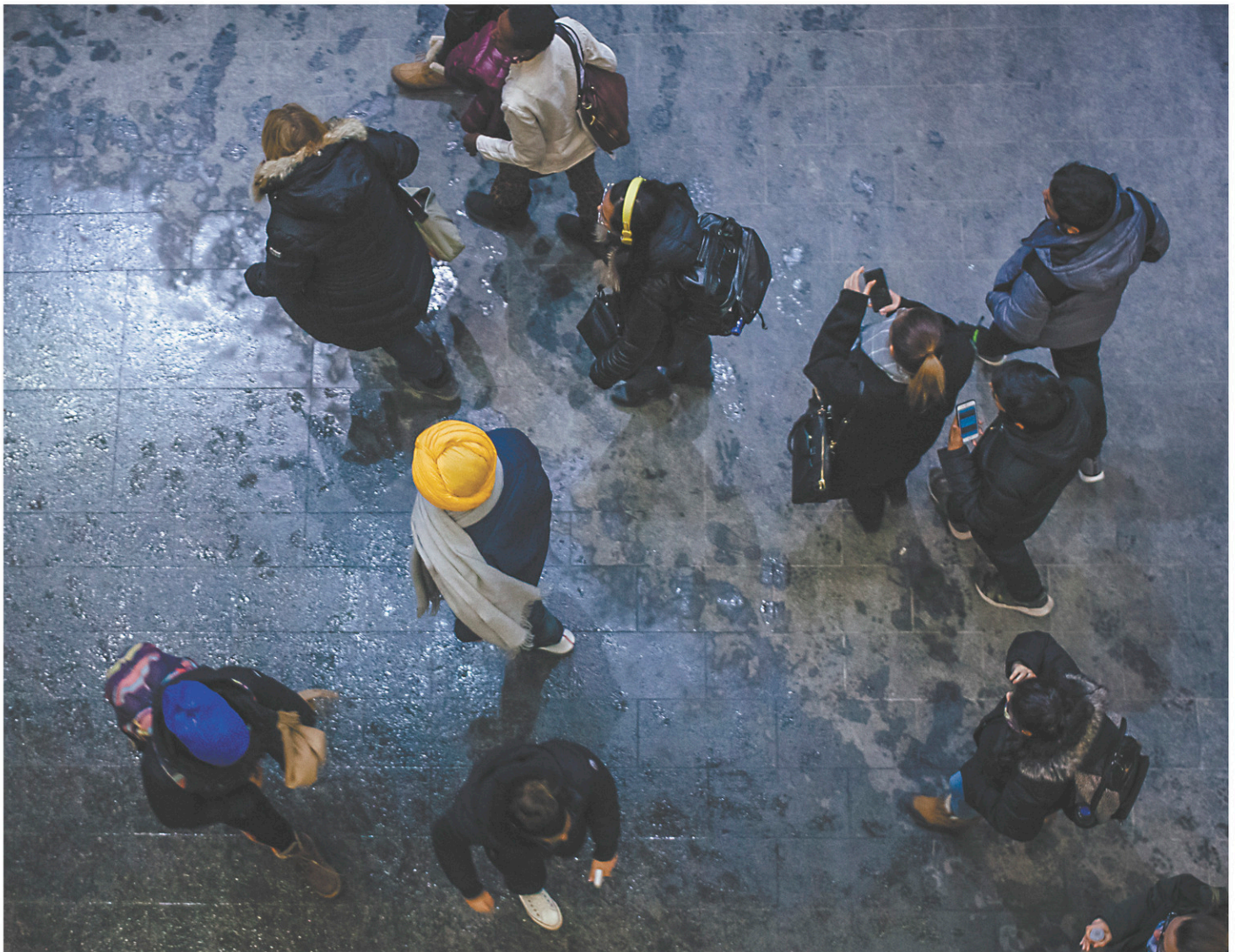
Le projet de loi sur l'interdiction du port de signes religieux sera déposé en début de session.

Le sondage de Mainstreet donne l'impression qu'une lourde chape bleue a recouvert l'ensemble du Québec, à l'exception de l'île de Montréal, où le PLQ est maintenant confiné. Avec 44,5 % du vote, la CAQ pourrait remporter jusqu'à 90 députés, du jamais vu depuis trente ans.